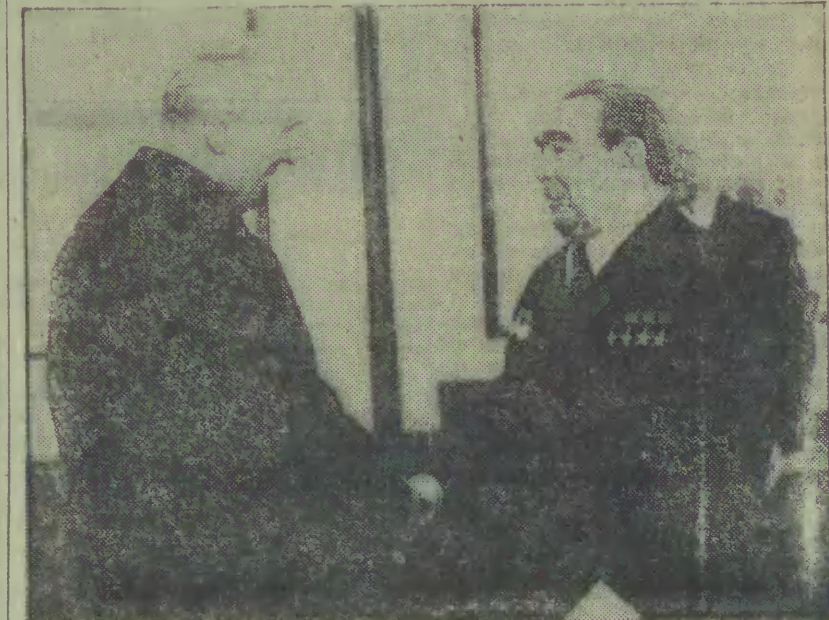
I sekretarz KC PZPR Edward Gierek spotkał się z sekretarzem generalnym KC KPZR, przewodniczącym Rady Najwyższej ZSRR Leonidem Breżniewem