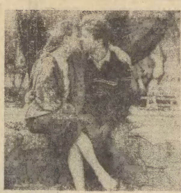
Wiosna w tym roku przy szła jakby wczesniej.