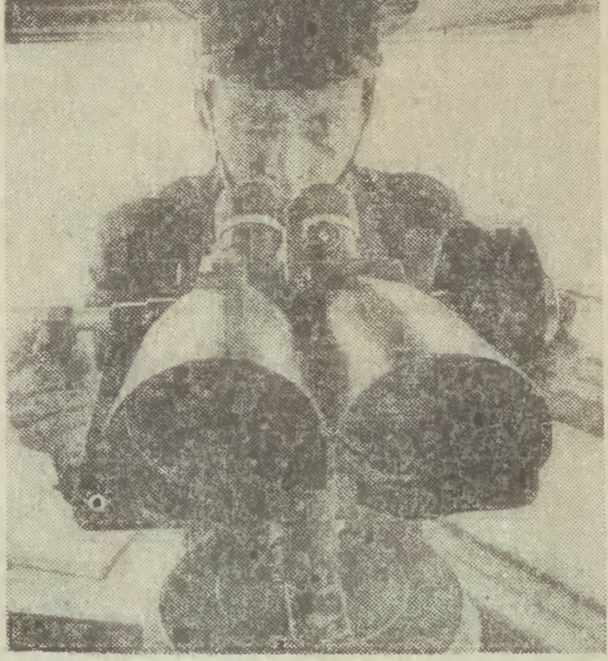
Zwierzenia zwiadowcy... Tak więc człowiek zwiadu ciągnie w górę koleję po fachu. Gdyby tylko...