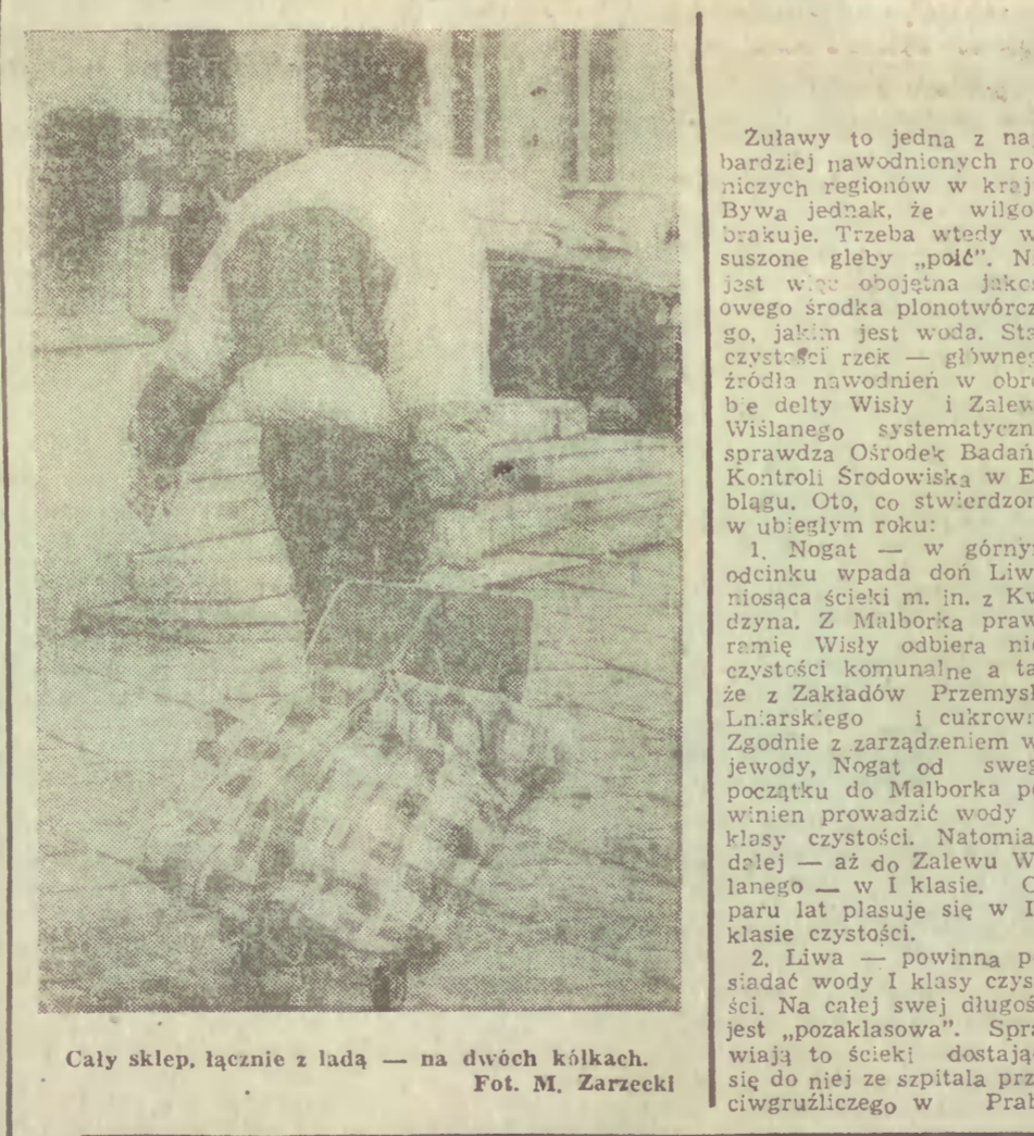
Cały sklep, łącznie z ladą — na dwóch kółkach.

Dyrektor — rada pracownicza — związki zawodowe, to trójkąt bermudzki polskiej gospodarki. W tym trójkącie ginie dobra kondycja naszych przedsiębiorstw. Ludzie w państwowych zakładach pracy zamiast walczyć o lepsze warunki, walczą o przetrwanie. Władze państwa zamiast walczyć o lepsze warunki, walczą o przetrwanie. Władze państwa zamiast walczyć o lepsze warunki, walczą o przetrwanie.