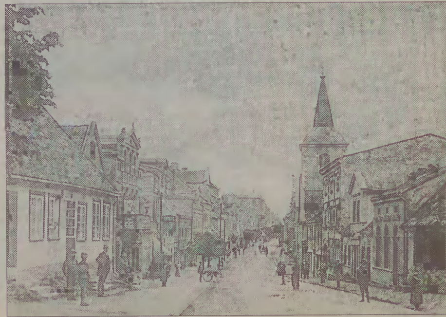
Reprodukcja fotografii A. Zimeusa z 1901 r. Dziś ul. Sobieskiego, dawniej ul. Łęborska.