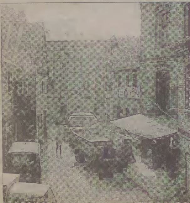
Zabytkowy młyn z XIX w. nad Cedronem należy do Cyrklaffa.

Artur Jabłoński