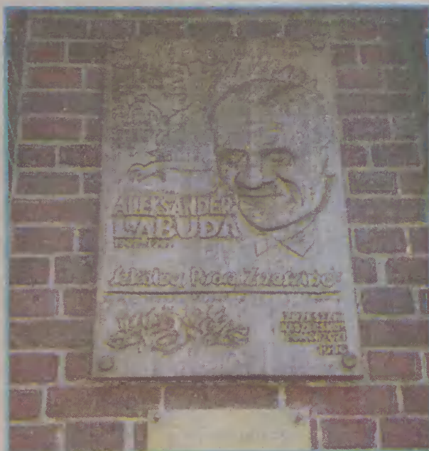
Na wyrzeźbionej tablicy umieszczono fragment wiersza poety oraz napis: Szkólny, Pisòrz, Zrzeszcinc.