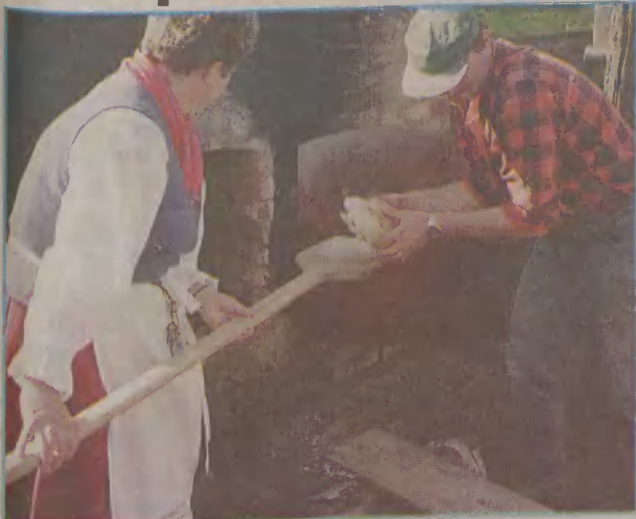
Do wyjmowania wypieczonego chleba służy deska, po kaszubsku zwana dzerztlą.