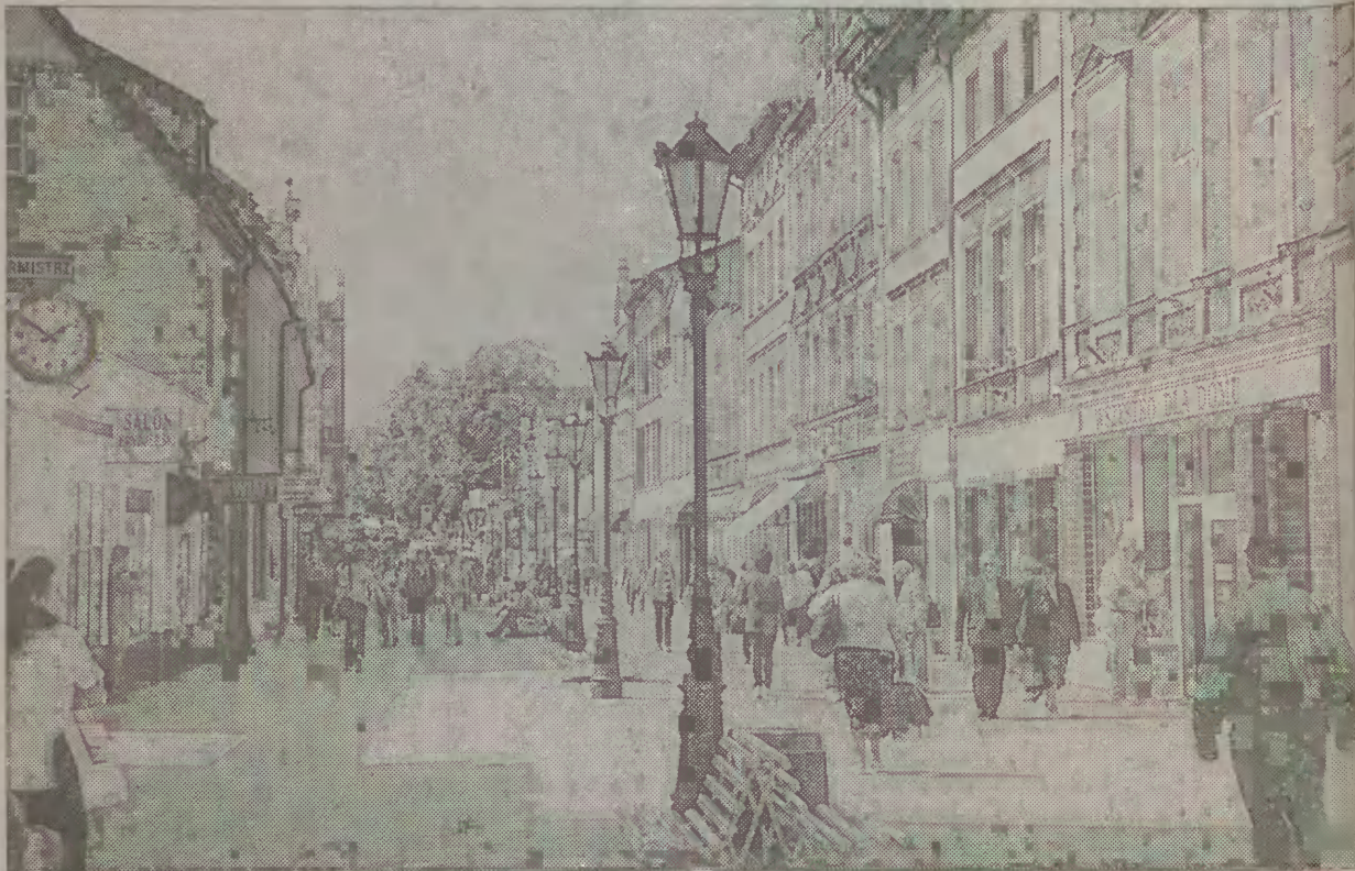
Ul. Sobieskiego, deptak w centrum Wejherowa.

Drugim co do wielkości miastem w powiecie wejherowskim jest Rumia. Dzieje Rumi sięgają czasów zamierzchłych. Archeologiczne badania dowiodły, że już w VI w. p.n.e. w rejonie Rumi dominowała ludność kultury wschodniopomorskiej zwanej też kulturą grobów skrzynkowych. Znane ze źródeł pisanych średniowieczne dzieje Rumi wiążą się nierozdzielnie z losami klasztoru cystersów w Oliwie. Wieś podarowana została zakonnikom przez księcia Pomorza Gdańskiego Świętopełka