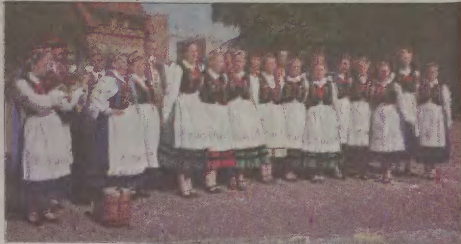
W starszej generacji Kaszëbów z Chojnic dominuje pięć rzeczywiście piękna.