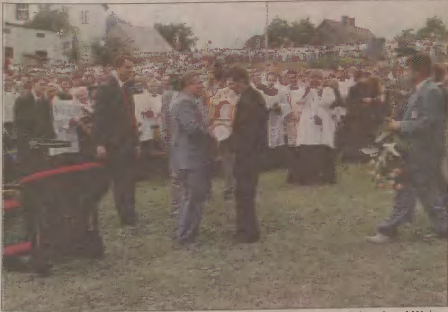
Parafianie sianowscy wręczają dzieło Kowalewskiego prezydentowi Lechowi Wałęsie.