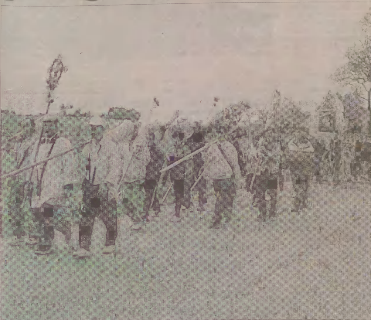
Do stóp Królowej Kaszub w Sianowie oraz Królowej Morza w Swarzewie w najbliższą niedzielę podążać będą pielgrzymi z całych Kaszub.