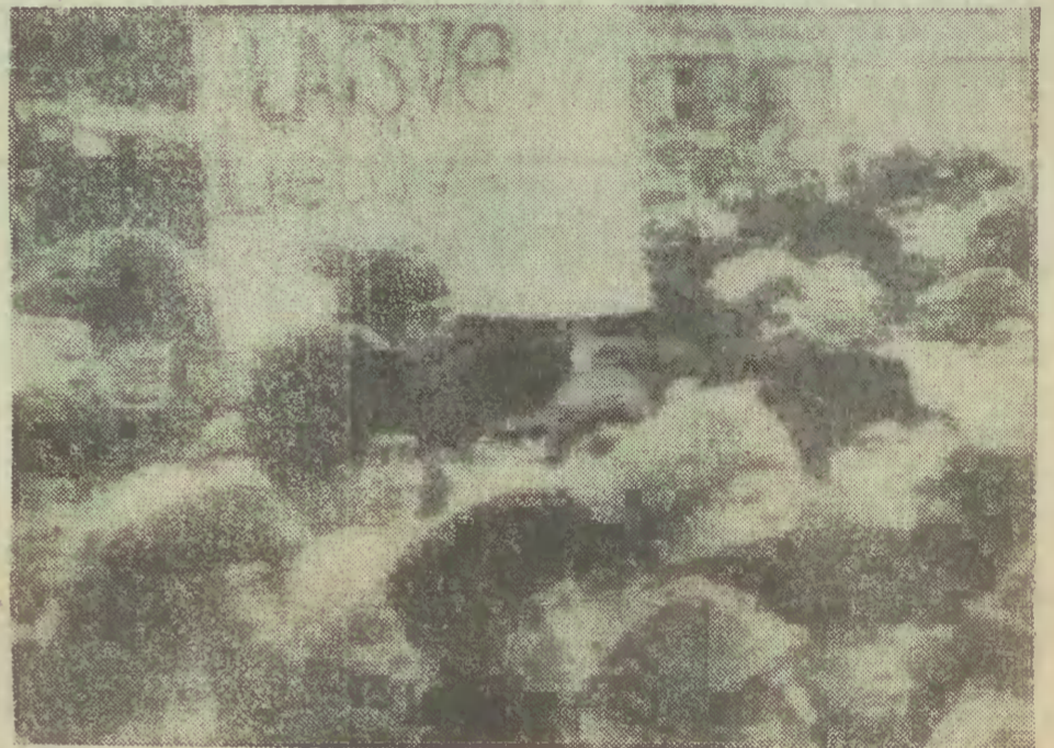
„Wolności dla Litwy” zgadało w niedzielę 400 tys. moskwian.