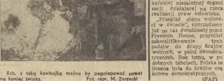
Ech, z taką kowbojką można by pogalopować nawet na koniec świata.

W pełni wolna Polska Największe postępy na drodze przemian demokratycznych dokonane zostały w 1990 r. w Chile, Czechosłowacji, na Węgrzech, w Niemczech i w Polsce — stwierdził doroczny raport sporządzony przez ekspertów Freedom House — amerykańskiej niezależnej organizacji działającej na rzecz realizacji praw człowieka. „Przeład stanu wolności w świecie”, sporządzony już po raz dwudziesty przez Freedom House, przyniósł zakwalifikowanie tych państw do grupy krajów wolnych, w pełni demokratycznych. Rok temu, w podobnych tabelach, Polska za licznymi krajami, w których częściowo demokratycznych. (PAP)