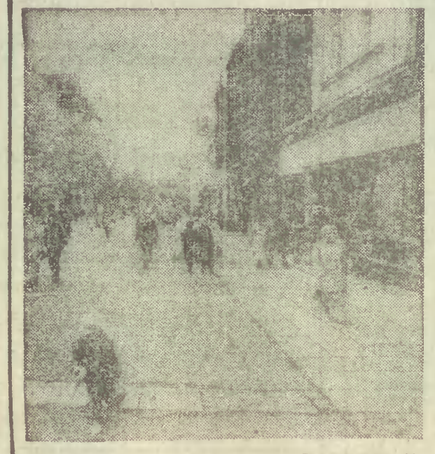
Na sopockim „monciku”.