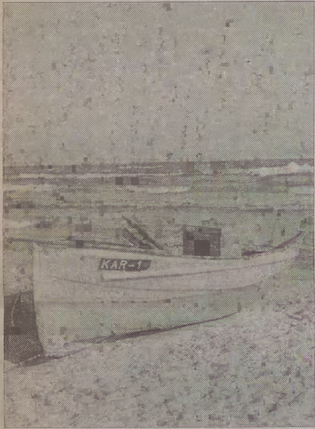
Bałtyckie rybołówstwo przybrzeżne zostało zepchnięte na margines życia gospodarczego.