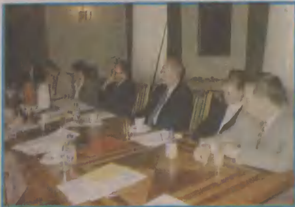
W ministerstwie poruszono ważne dla edukacji i kultury w regionie problemy.