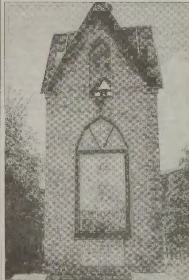
Odbudowana kapliczka w Stanisławowie