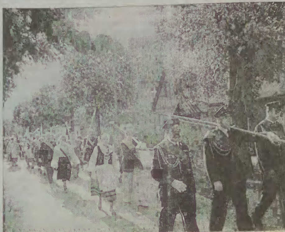
Pochód ruszył do kościoła