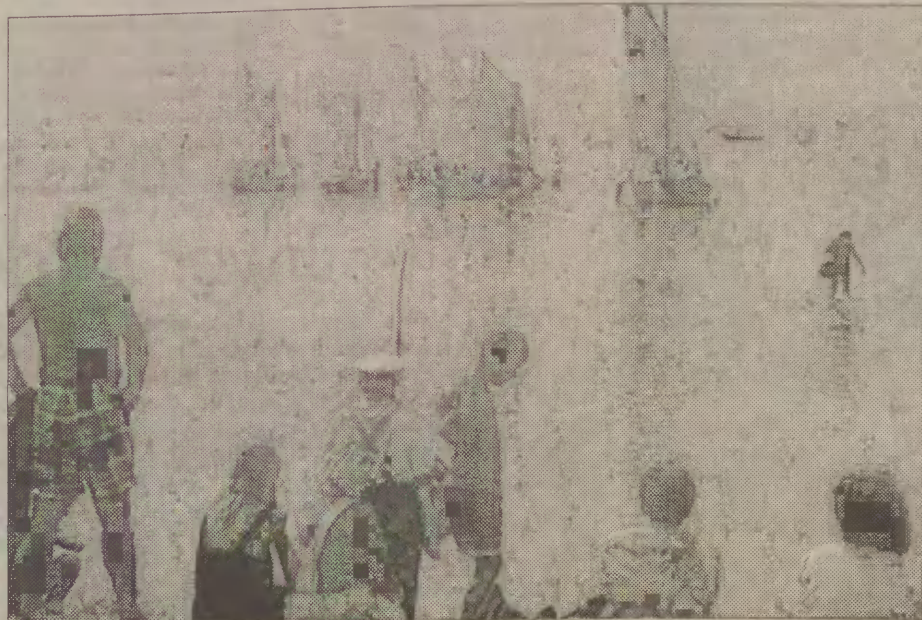
Czë za pòrà lat mdze kòmu bieżëc na „Kaszëbsczich bôtach pòd żóglama”

Jò czedës napisòł, że w „Kaszëbsczich bôtach” nie chòdzy ò nòdgròdë. Ie ò to, chto je w swòjim fachù nòlëpszi. Tak bëło przez ne wszëtczë lata. Terò czas