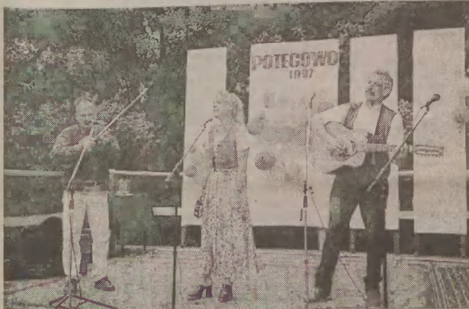
Zespół Zayazd był prawdziwą gwiazdą festynu w Potęgowie.

Trzy utwory zarejestrowano przez Gdańską Telewizję. Będą emitowane w magazynie kaszubskim „Rodno Zemian”.