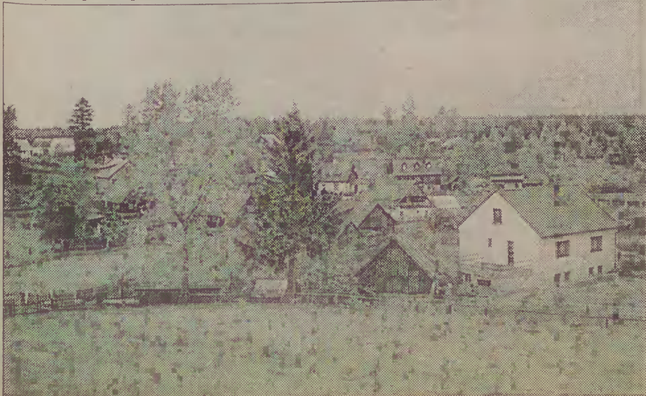
Widok na Juszki z podwórka pana Pika. Wieś mało już przypomina tę z opisu w „Bedekerze kaszubskim”.