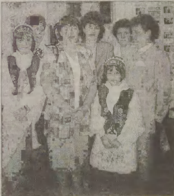
Niektóre z uczestniczek kursu.

Wystawa haftu będąca pokłosiem kursu, czynna będzie do końca maja. Można na niej obejrzeć przede wszystkim przeróżne serwety, obrusy, poszewki, ubranka dla lalek, a nawet koszule męskie i damskie z kaszubskim haftem. Wszystko to umiejętnie wkomponowane jest pomiędzy eksponaty muzealne, a w niektórych przypadkach stało się ozdobnikiem tychże eksponatów.