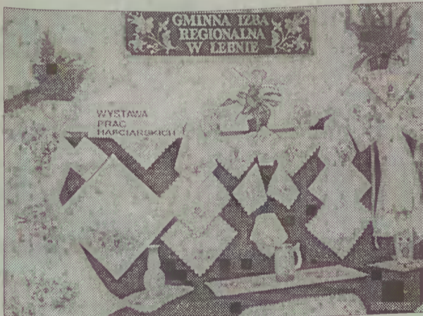
Wystawa prac hafciarskich w Łebnie.