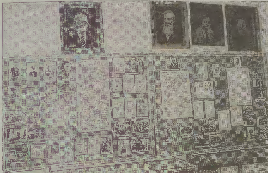
W Izbie Regionalnej można znaleźć fotografie przedstawiające starą Kościerzynę, kaszubskie rękodzieło i sztukę ludową, portrety i dokumenty z działalności wybitnych postaci Kaszub.