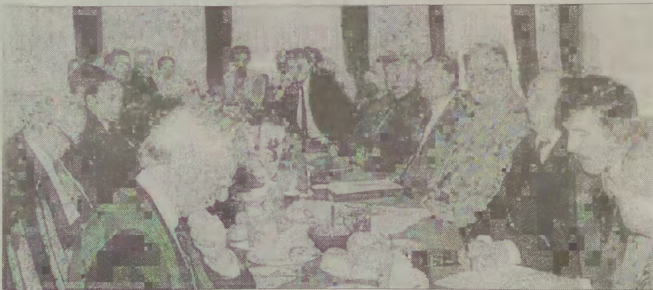
W sali obrad w Dworku pod Lipami w Rumi.