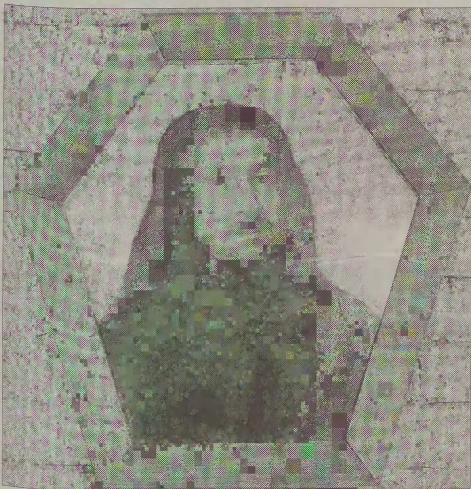
Portret trumienny Jakuba Wejhera.