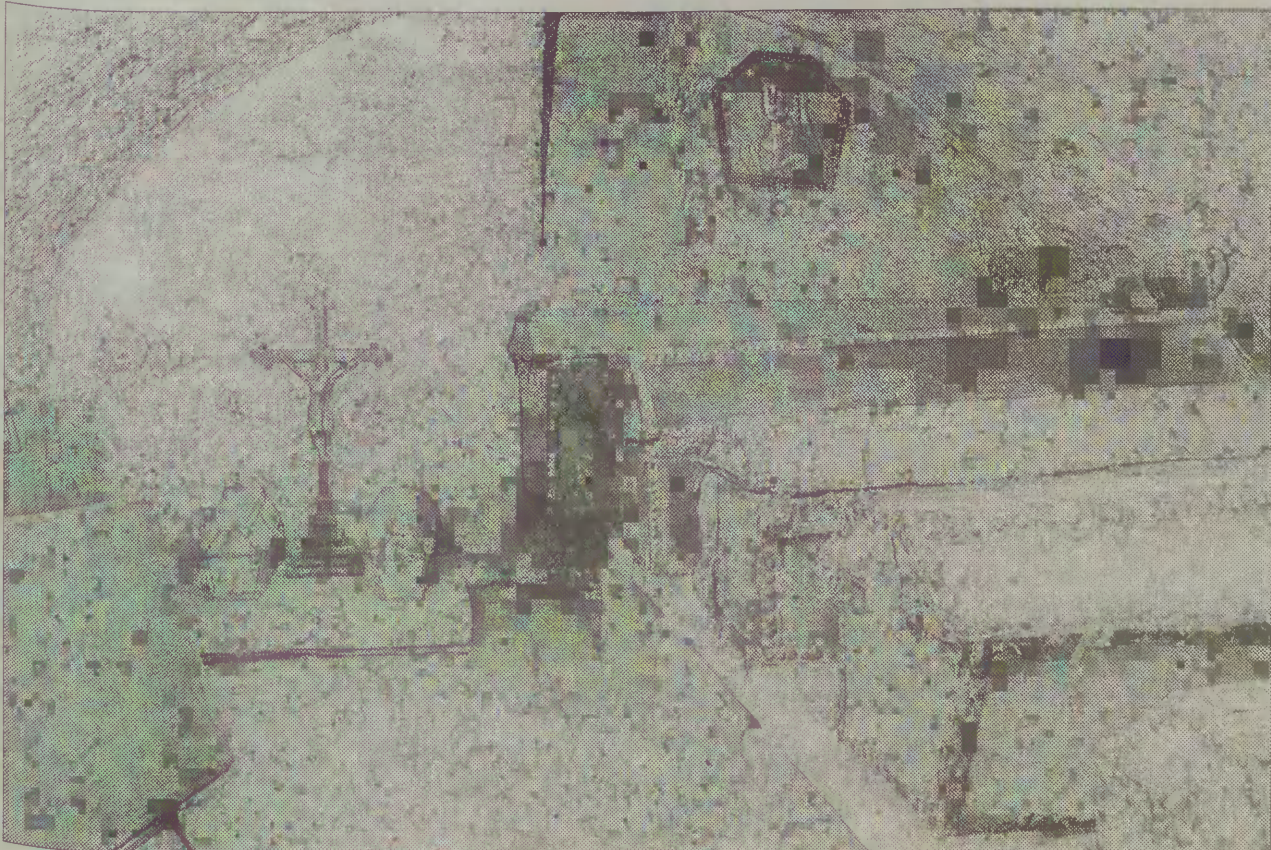
Krypta grzebalna rodziny Jakuba Wejhera. W drugiej trumnie od ściany szczytowej spoczywa założyciel Wejherowa.