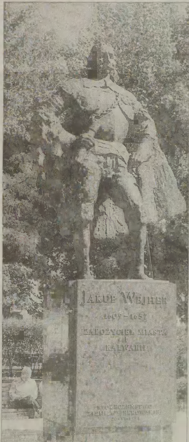
Pomnik Jakuba Wejhera w Wejherowie.