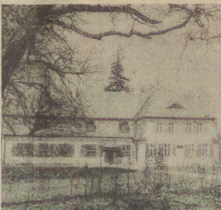
Dworek w Będzynie.

Na podstawie badań historycy architektury i konserwatorzy podjęli decyzję o przywróceniu starszej części zabudowy mieszkalnej kształtu z okresu, w którym żył Wybicki. Wspomniono uwzględniono zmianienia okolicznych mieszkań, którzy pamiętali, że np. przed 1938 r. od strony podwórza gospodarstwo znajdowała się jadalnia (kryształowy żyrandol z tego pomieszczenia znajduje się obecnie w kościele w Rekownicy), przedciełek,