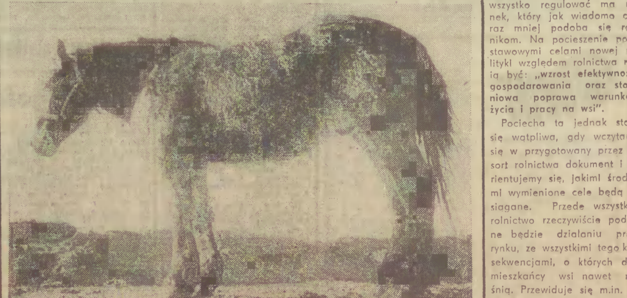
CSIO?! Też chciałbym tam poskakać...