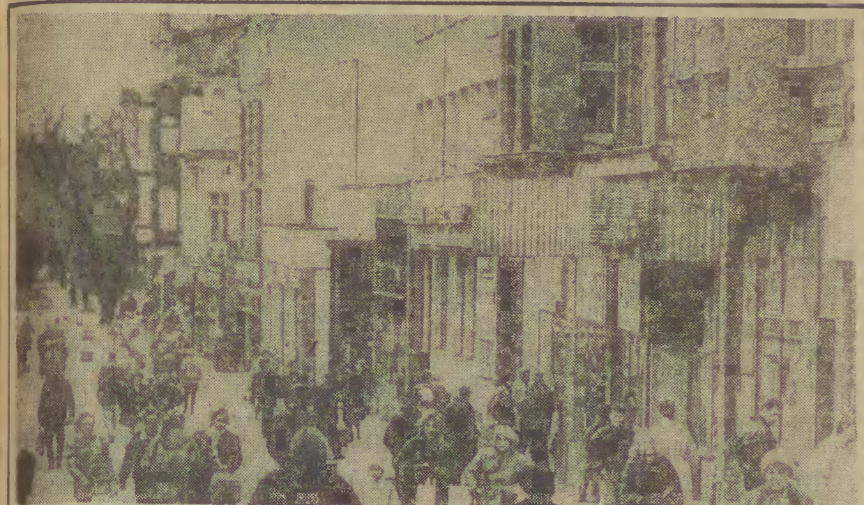
Sopot - ulica Bohaterów Monte Cassino.