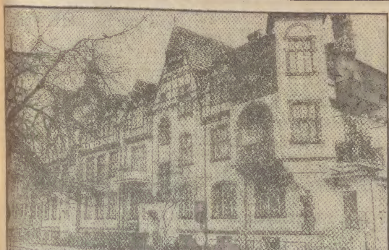
Secesyjne kamieniczki przy ul. 22 Lipca w Sopocinie.