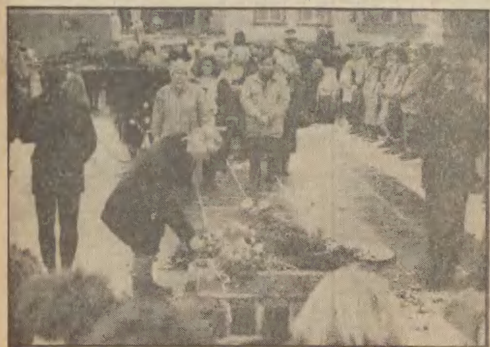
Uroczystość składania wienków pod pamiątkową płytą w Sopocie.

UROCZYSTA AKADEMIA w Teatrze „Wybrzeże” KWIATY W MIEJSCACH PAMIĘCI