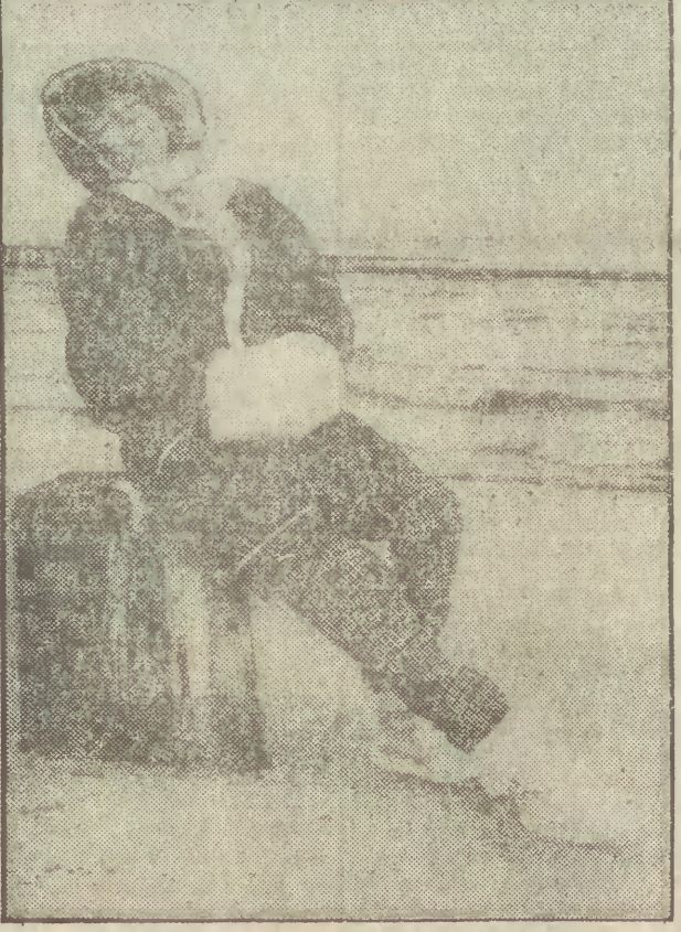
Uśmiech — na przekór jesieni.