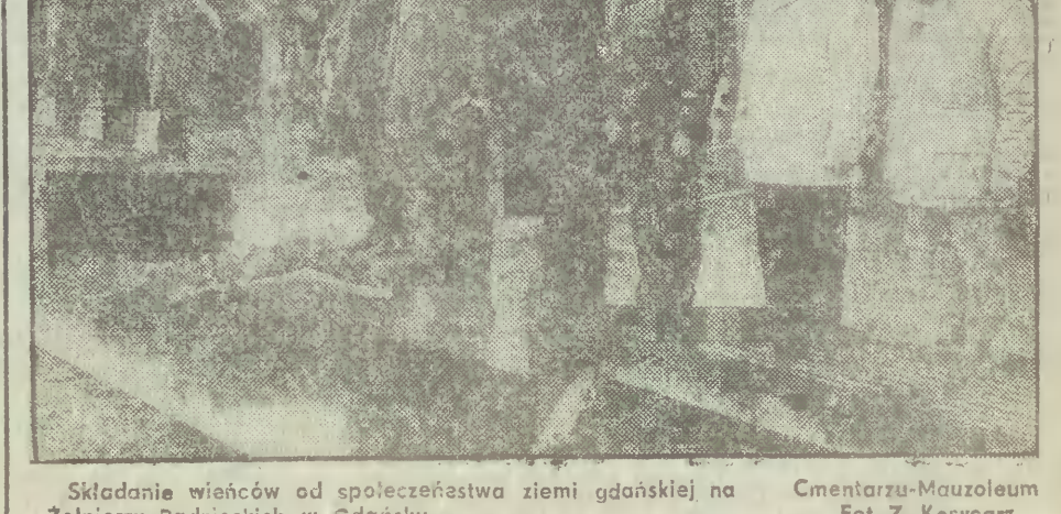
Składanie wieńców od społeczeństwa ziemi gdańskiej na Cmentarzu-Mauzoleum Żołnierzy Radzieckich w Gdańsku.

Uroczyste koncerty i akademie w Gdańsku i Elblągu • Kwiaty pod pomnikami i na cmentarzach żołnierzy radzieckich