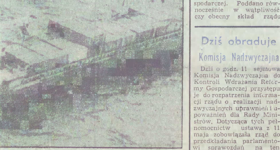
Nikt nie chce przyjąć na swój teren toksycznych odpadów. Działalność ochrony środowiska nie dopuściła do zawinienia w brytyjskim porcie Plymouth zachodniemieckich frachtowców...