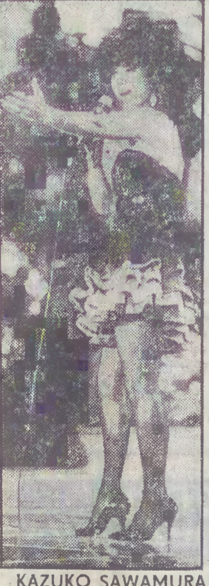
KAZUKO SAWAMURA (Japonia).