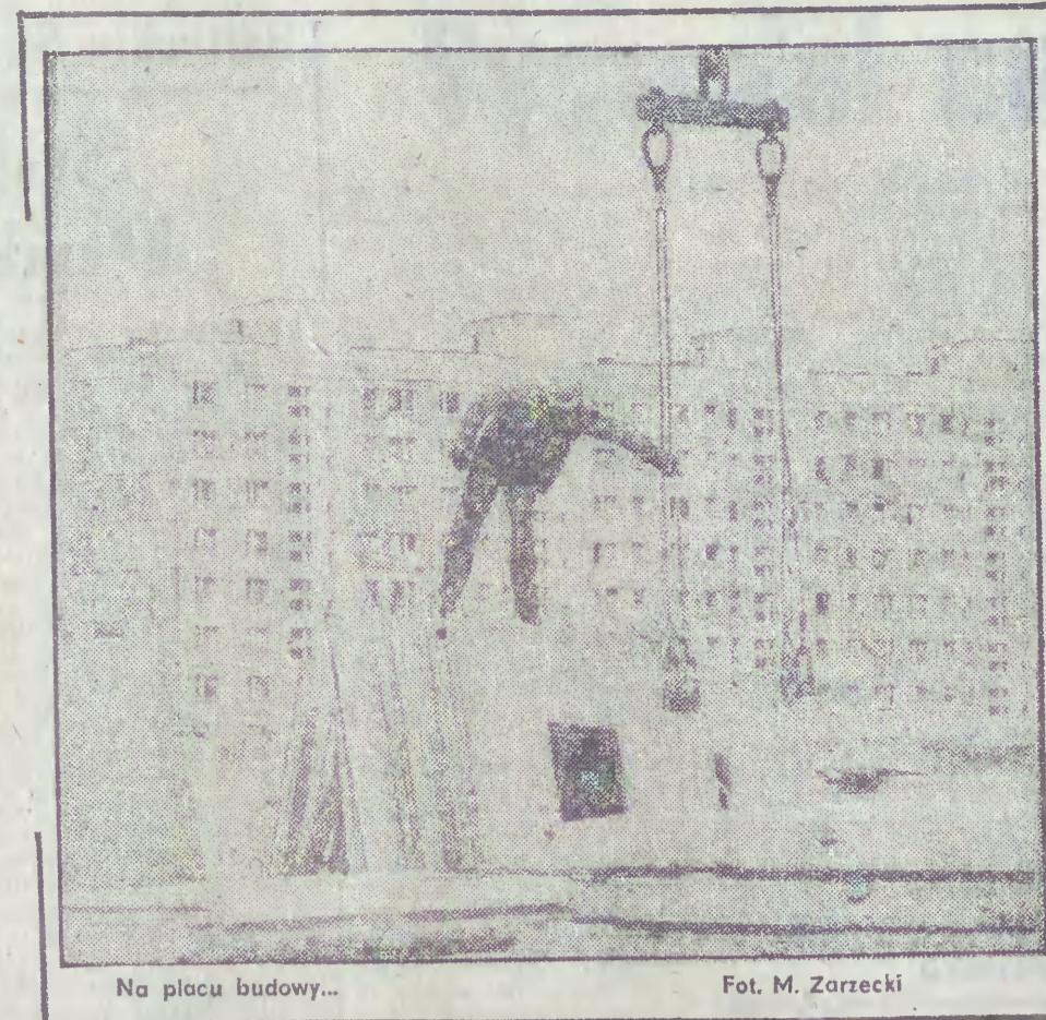
Na placu budowy...

„Wszystko to razem wzięte, mimo lokalnych wysiłków i starań wojewódzkiej administracji, nie poprawi radykalnie sytuacji w naszym gdańskim województwie. Programy wojewódzkie muszą uzyskać wsparcie w budżecie centralnym, także w zakresie zaopatrzenia materiałowego. Ostatnie zdanie programu „Gdańsk 2000” brzmi: „budownictwo mieszkaniowe sprężone jest z infrastrukturą techniczną i społeczną i tylko kompleksowa ich realizacja zapewni właścicielom budynków osiedli, dzielnic i miast”.