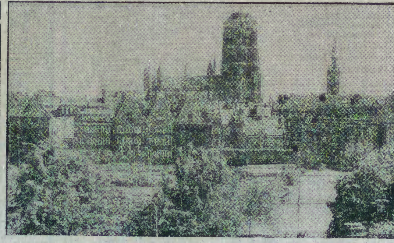
Gdańsk — Targ Drzewny.

Wydawnictwo Książka i Wiedza, Wzd. I. Str. 478 Cena 900 zł. Wydawnictwo Książka i Wiedza, Wzd. I. Str. 282 Cena 350 zł. Wydawnictwo Książka i Wiedza, Wzd. I. Str. 200 Cena 490 zł. Wydawnictwo Książka i Wiedza, Wzd. I. Str. 662 Cena 1500 zł. Wydawnictwo Książka i Wiedza, Wzd. I. Str. 282 Cena 350 zł. Wydawnictwo Książka i Wiedza, Wzd. I. Str. 200 Cena 490 zł. Wydawnictwo Książka i Wiedza, Wzd. I. Str. 662 Cena 1500 zł. Wydawnictwo Książka i Wiedza, Wzd. I. Str. 282 Cena 350 zł. Wydawnictwo Książka i Wiedza, Wzd. I. Str. 200 Cena 490 zł.