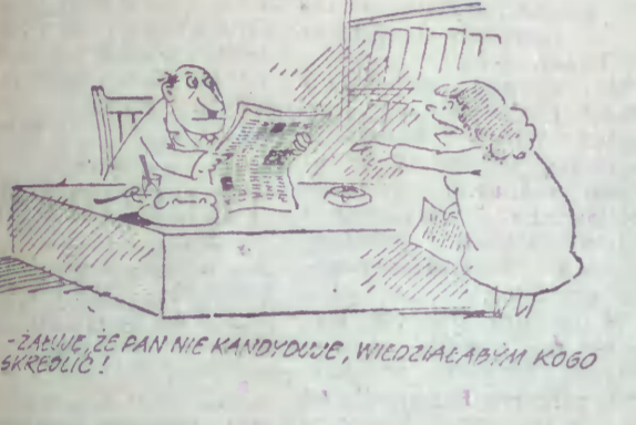
ZAMIE, ŻE PAN NIE KANDYDUJE, WIEDZIAŁABYM KOGO SKRZYŚĆ!