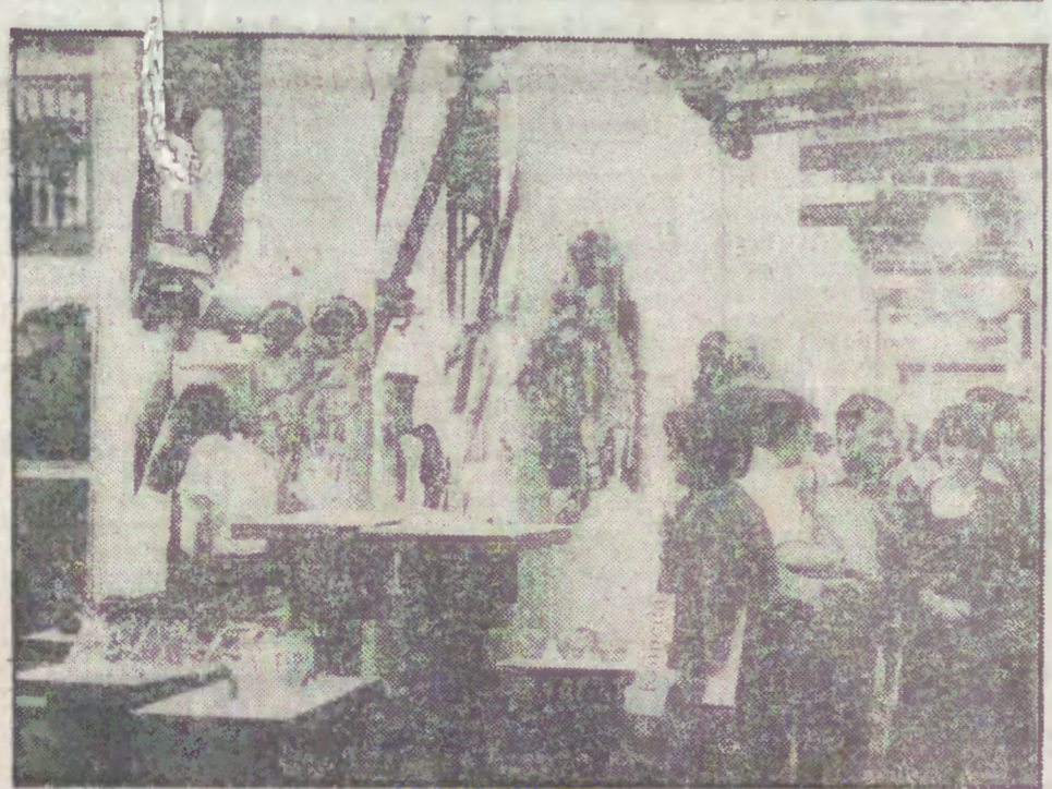
Fragment ekspozycji „Galeriada '88”.