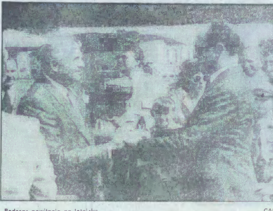
Podczas powitania na lotnisku. CAF

A.P. Wizyta Gorbaczowa stwarza polskiemu władzom szanse wypuklenia własnej przebudowy w polityce