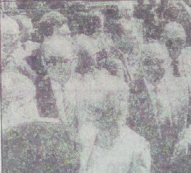
Ta sama, co na lotnisku w Warszawie. Na transparyście — „Pierwszoklasa z blizną”. Jesteśmy z Tobą, Gorbaczowie.

M. Gorbaczow zasugerował też przeprowadzenie — jak to ujął — ogólnoeuropejskiego Reykjaviku — spotkania przywódców wszystkich krajów europejskich, na którym przedyskutowana byłaby tylko jedna sprawa — jak wyjąć z obecnego zakłętego kręgu i przejść do słów do czynów w dziedzinie redukcji zbrojeń konwencjonalnych.