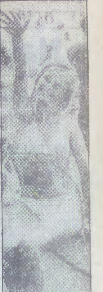
Taki uśmiech potrafił chyba „rozbroić” każdego malkontenta!

Obywatele polscy mogą przewozić przez Bułgarię każdą ilość towarów bez ograniczeń, pod warunkiem wypełnienia deklaracji w dwóch egzemplarzach. Problemy rodzą się wówczas, gdy nasi rodacy usiłują wyjechać z tego kraju z niezbędnymi bagażami. Na granicy rumuńskiej żąda się kaucji, której wysokość jest dowolnie ustalana