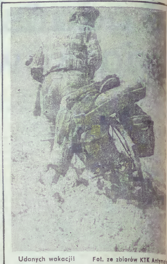
Udaných wakacji!