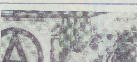
Pisałmy niedawno o brudnych wysepkach autobusowych przed Dworcem Głównym PKP. Nasz fotoreporter zwrócił m. jn. uwagę na przepelnione kosze ze śmieciai, właśnie na przyworo-wym przystanku. W niektórych tego typu miejscach pojemników w ogóle brakuje. Nie ma ich np. na przystanku autobusowym przy al. K. Marksa, mniej więcej naprzeciwko kawłarni „Cyganeria” (po drugiej stronie ulicy). Moze z tego powodu wokół tamtejszej wiaty leży mnóstwo papierków i niedopalków, zaśmiecających nawet pobliskie lasek.

— czynne całą dobę w szpitalu im. M. Kopernika w Gdańsku, ul. Świerczewskiego nr 1-6 (wejście nr 2) — wypadki, nagłe zachorowania i przewożony chorych, tel. 22-29-29, 32-55-14 i 32-39-24 — Laryngolog przyjmuje w dni powszednie w g. 20-7.30, w soboty i niedziele w g. 17.30-7, w wolne soboty, niedziele i święta cała doba — wypadki, nagłe zachorowania i przewożony chorych, tel. 41-10-00, 32-39-44 — Ambulatorium chirurgiczne czynne cała doba Gdańsk-Zaspa, ulica 30-lecia PRL 56 — czynne cała doba tel. 999 — wypadki, nagłe zachorowania i przewożony chorych, telefon 20-90-02, 20-06-02 Oliva, ul. Białowieska 1 — czynne w dni robocze w g. 15-7, w święta i dni wolne od pracy — cała doba, telefon 25-19-98 Dzizyruja lekarze: ogólny, pediatra i chirurg w g. 19-7, stomatolog — w soboty, niedziele i święta w godz. 11-7 — w pozostałe dni w godz. 20-7 WJAZDOWA POMOC LEKARZY SPECJALISTÓW, oddzielnia w g. 10-21 telefon 56-54-55 DZYZURY LEKARZY W PRZYCHODNIACH W REJONIZACJI — Gdańsk, ul. Jaskółcza 7-9 — lekarz ogólny, gabinet zabiegowy dla dorosłych w wolne soboty, niedziele i święta — cała doba, w pozostałe dni w godz. 18-9 — Gdańsk, ul. Aleksandra I — gabinet zabiegowy i porodnia dla dzieci chorobe w wolne soboty, niedziele i święta — cała doba, a w pozostałe dni w godz. 19-7 Dzizyruja sto