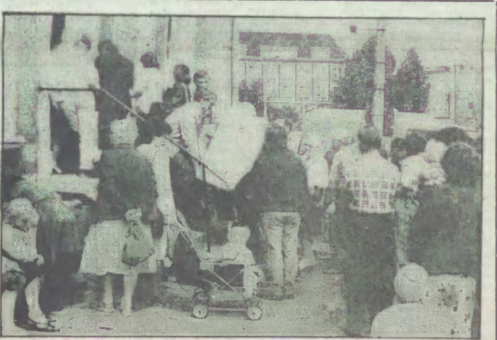
Samo życie (kolejkowe...)