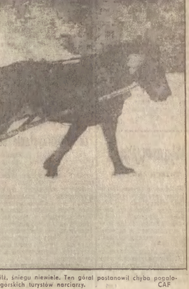
W Tatrach czwartego dnia wieje halny, w Zakopanem odwiał, śniegu niewiele. Ten górski postanowił chyba pogodzić... zimą... i śnieg dla coraz bardziej markotnych górskich turystów narciarzy.

W komunikacie opublikowanym w piątek w siedzibie koncernu w Detroit kierownik Forda i własnej inicjatywy zdecydował się wycofać ponad milion modeli z lat 1988-89 po to, by uwzględnić w nich przewidywany wzrost sprzedaży. ● Dokończenie na str. 2