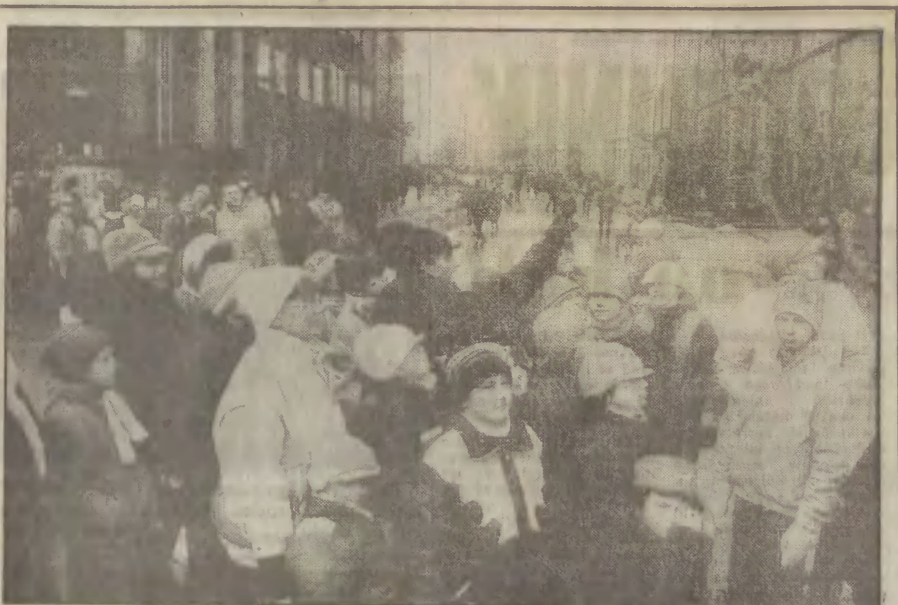
W czasie ferii warto zoba czyć gdańskie zabytki.