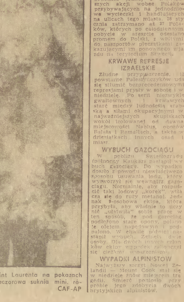
Jedną z propozycji Yves Saint Laurenta na pokazach w Paryżu kolekcji mody — wieczorowa sukienka mini. RÓ-CAF-AP zowa w turkusowej kwiaty.