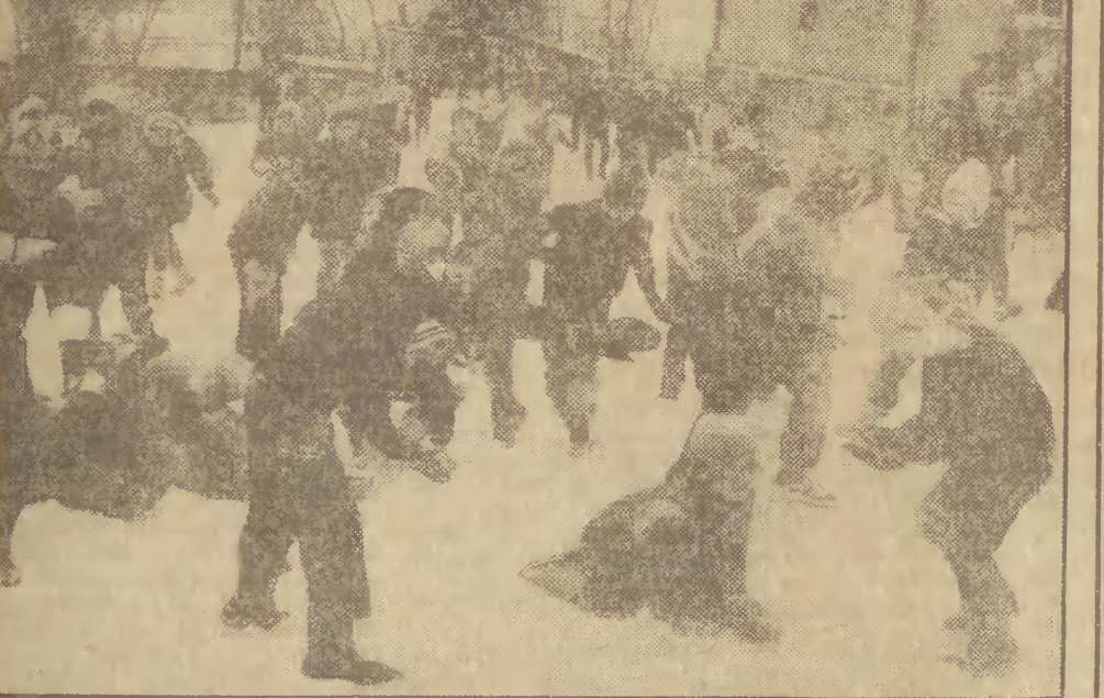
Tak naprawdę rozpoczęły się w piątek po lekcjach, ale oficjalnie od dziś FERIE! Jest śnieg, najmłodszym humoru dopisują, więc zabawa będzie na sto dwa!!!