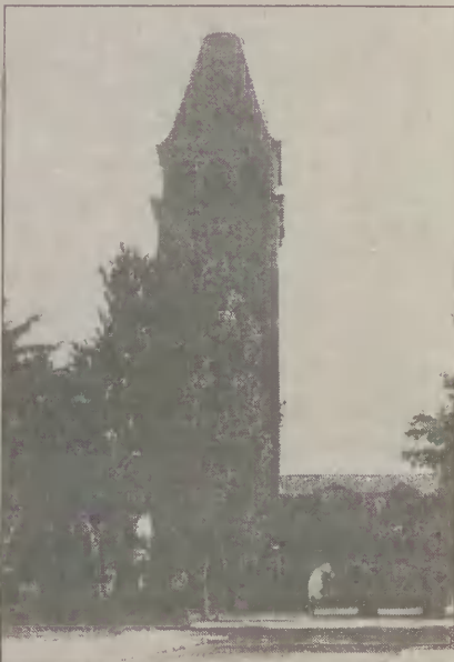
Dom Rybaka we Władystawowie - siedziba władz miasta