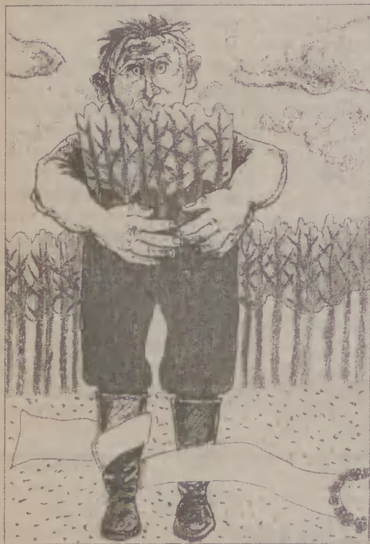
„Stolem”, autor: B. Gostkowska

plugiem wsadził go do palca u rękawicy. W domu położył rękawicę na stole i rzekł do swojej matki: