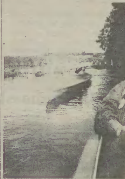
Na jednym ze Splywów Kajakowych „Śladami Remusa”

Klub Turystyczny Zrzeszenia Kaszubsko-Pomorskiego „Wanożnik”, który stał się głównym organizatorem splywów.