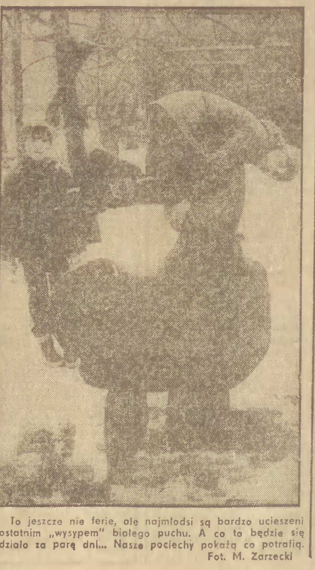
To jeszcze nie ferie, ale najmłodszy są bardzo ucieszeni ostatnim „wysypem” biologicznego puchu. A co to będzie się działo za parę dni... Nasze pociechy pokają co potrafią.

W Szpitalu Miejskim w Zamościu u 27 jego pracowników i u 2 pacjentów stwierdzono ciężkie objawy zatrucia salmonellą. Decyzją wojewódzkiego inspektora sanitarnego zamknięto za sanitarnego zamknięto za stał oddział położniczo-ginekologiczny, skąd pochodzi największa liczba zarażonych osób, a tym samym latwiej największe zagrożenie dla chorych, położnic i niem wlat. Stwierdzono, że źródłem zarażenia salmonellą był pasztet przygotowany w przychodni kuchni. Pieczony zbyt krótko i w zbyt niskiej temperaturze. (PAP)