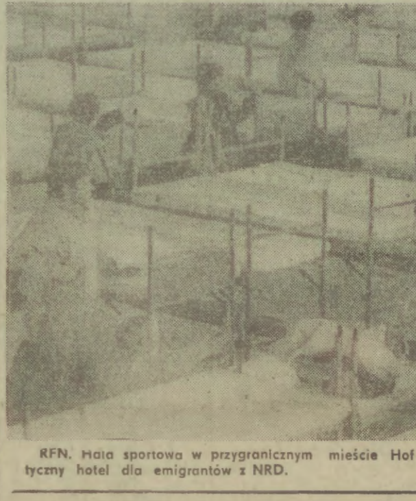
RFN. Hala sportowa w przygranicznym mieście Hof zamieniona została na gigantyczny hotel dla emigrantów z NRD.

• Bezprecedensowe wybory Mimo otwarcia granicy NRD liczba obywateli tego kraju, pragnących na stałe zamieszkać w RFN, nie jest zbyt wielka. Większość przyjeżdża do RFN na podróże turystyczne. Ulice Berlina Zachodniego są znacznie spokojniejsze w porównaniu z chaosem w ciągu weekendu. Centrum miasta oczyszczone z ton śmieci, pustych pudełek kartonowych po artykułach spożywczych, zblitych butelek pozostawionych przez ok. 2 mln mieszkańców NRD którzy przez kroczyli granice od czwartku. Przybycie z NRD stoją w kolejkach przed bankami po 100-markowy załask, oferowany przez rząd niemiecki. Trzeba ich jednak liczyć na tydzień, a nie setki, jak to było w sobotę i niedziele. Większa jest też liczba osób starszego pokolenia. Wiele osób przekracza mur tylko po to, by rozszerzyć się po ulicach Berlina Zachodniego z zamiarem pod... • Dokończenie na str. 2