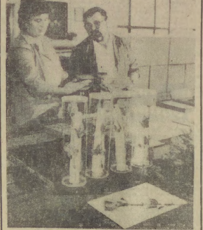
Na Węgrzech produkują się z drutu kolczastego, usuniętego z nasieków na granicy z Austrią, „kolczaste róże”. Sprzedawane są one jako pamiątki po „żelaznej kurtynie”. Jedną z takich róż otrzymał w czasie swej wizyty w Budapeszcie prezydent USA — George Bush.