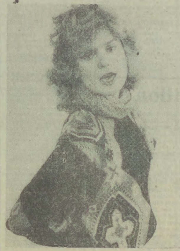
Mając tak piękny i ciepły sweter — wcale się nie przezięłam wczorajszym przedsmakiem jesieni!

Dla upamiętnienia 50 rocznicy wybuchu II wojny światowej na obszarze całego kraju przewidziane zostało w dniu 1 września 1989 roku, o godz. 12.00 włączenie syren i zatrzymanie ruchu ulicznego na 1 minutę. (PAP)