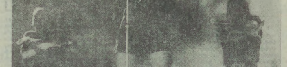
Dyskotekowa gwiazda festiwalu - C.C. Catch.