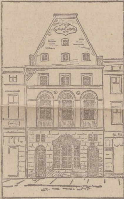
Hofapotheke nach dem Umbau.

doch vollkommen neu und passend gemacht werden. Es läßt sich im Hause Raum schaffen für die modernsten Bedürfnisse, und das Gepräge der alten Zeit kann erhalten bleiben. Unsere Baukunst hat dafür bereits viele treffliche Beispiele, und ein