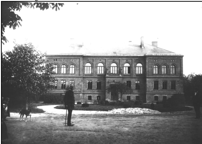
Budynek sławieńskiego progimnazjum na zdjęciu z roku 1900 Schlauer Progymnasialgebäude auf dem Foto aus dem Jahr 1900

richtet wurde, war der eines Gymnasiums. Der Entschluss den gymnasialen Lehrplan zu Grunde zu legen, ist nicht ohne Kampf erfolgt, hatte man doch am 28. November 1860 in Magistrat und Stadtverordnetenversammlung einstimmig die Errichtung einer Realschule erster Ordnung mit dem Schaffen von 6 aussteigenden Klassen beschlossen und war nur infolge der hohen Kosten von diesem