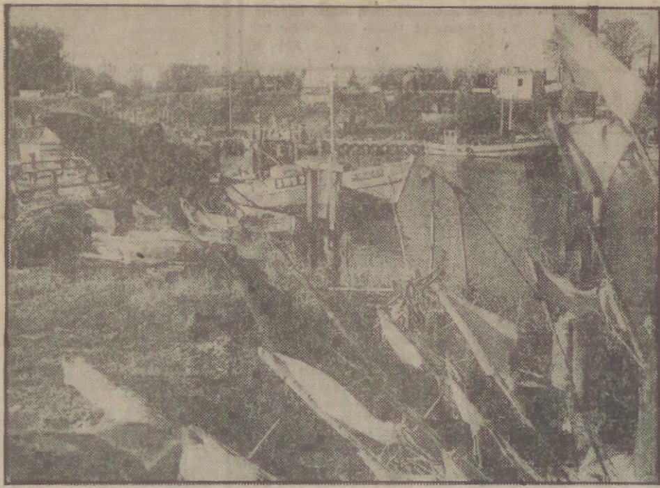
Port rybacki w Swinie.

W niedzielę doszło do wielkiego karambolu na autostradzie Monachium - Norymberga. Zderzyło się 37 samochodów, 60-letni kierowca z Frankfurtu nad Menem doznał ataku serca i zmarł. Jego żoną, z zaburzeniami układu krążenia, odwieziono do szpitala. 10 innych osób doznało różnych obrażeń.