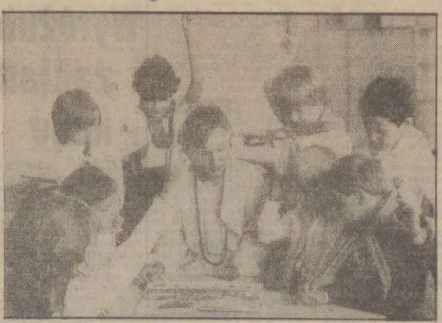
Pierwszy dzień w szkole. Niektóre dzieci już się znają, razem chodzą...