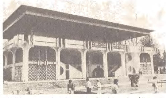
„Saoddi” - nowa herbarciarnia w stolicy Tadżykistanu, Duszombie.