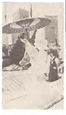
Ta piękna rzeźba z lodu zdobyła pierwszą nagrodę w konkursie iedowej rzeźby, który odbył się na tarasie jednego z tokijskich domów towarowych. W konkursie brało udział 115 rzeźbiarzy z całej Japonii.