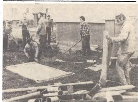
Na osiedlu Budowniczych Polskiej Ludowej w Słupsku trwają prace ziemne związane z przyłączeniem przyszłych abonentów telefonicznych do sieci miejskiej. Pracownicy Gdańskiego Przedsiębiorstwa Roboty Telekomunikacyjnych kopią rowy do położenia rur PCV, w których ułożone będą łącza telekomunikacyjne. Jedna szafka może zawierać 1200 numerów telefonicznych. (bz)

wartościowe, które jednak mogą być spożytkowane w produkcji artykułów rynkowych przez drobnią wytwórczość. Przedmiotem czterodniowych pertraktacji handlowców i producentów będzie zawieranie umów na dostawy artykułów rynkowych na pierwsze półrocze 1985 r., a także poszukiwanie możliwości dodatkowych dostaw towarów jeszcze do końca br. (PAP)