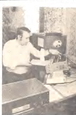
W PPIUR „Barka” zamontowany został japoński odbiornik map synoptycznych za pomocą satelitów. Tu w Kolobrzegu odbiera się komunikaty i mapy pogodowe z Międzynarodowego Centrum Meteorologicznego ze stacji Offenbach z RFN, a także Norrköping k. Sztokholmu. Odbiór map pozwala prognozować pogodę na 3 dni naprzód. Umieszczenie to wysycie kółków na krawędziach mapy synoptycznej (kart). (ak)

W miesiącu pamięci poległych i pomordowanych w walkach wrześniowych i II wojnie światowej Polaków odbyła się w Warszawie — z udziałem Henryka Jabłońskiego — uroczystość odsłonięcia na Powązkowskim Cmentarzu Komunalnym (dawnym wojskowym) mauzoleum ofiar hitlerowskich obozów koncentracyjnych. Napis na monumentie głosi: „Prochy Polaków pomordowanych w hitlerowskich obozach koncentracyjnych — wołają o pokój świata”. Uroczystość zgromadziła wielu przedstawicieli środowisk byłych więźniów, społeczeństwa stołeczki, zakładów pracy, organizacji kombatanckich, młodzież. (dokończenie na str. 2)