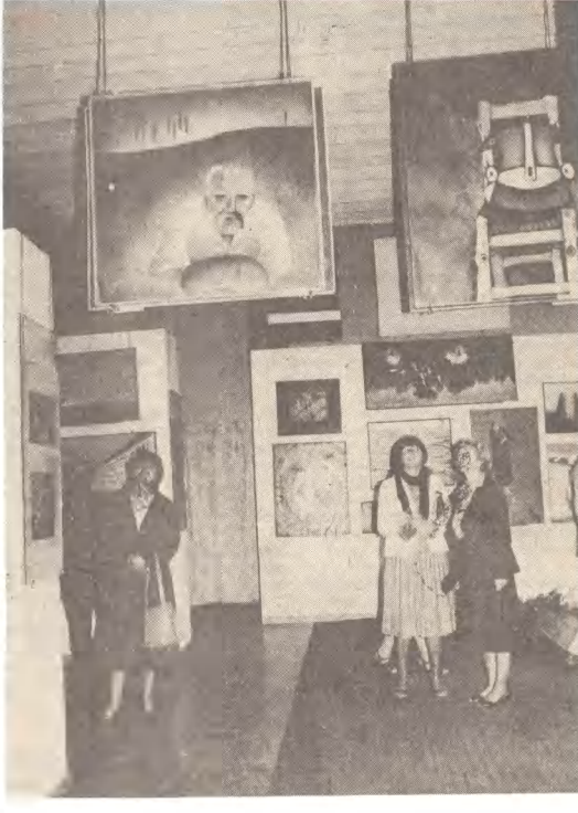
Jubileuszowa wystawa w kolobrzkiej Małej Galerii