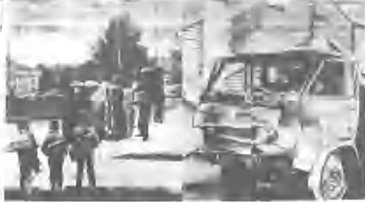
Deszczowa pogoda powinna zmusić kierowców do wywołania sztucznej mgły...