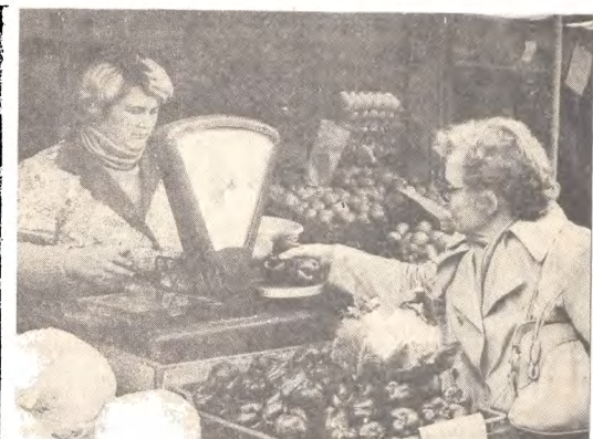
Jesienną porą — największe królestwo warzyw na straganach.