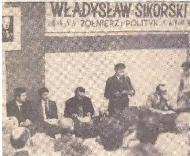
20 maja w rzeszowskiej Wyższej Szkole Pedagogicznej rozpoczęła się ogólnopolska sesja naukowa z okazji 100-lecia urodzin Władysława Sikorskiego.