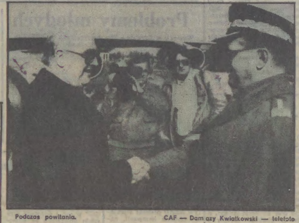
Podczas powitania.