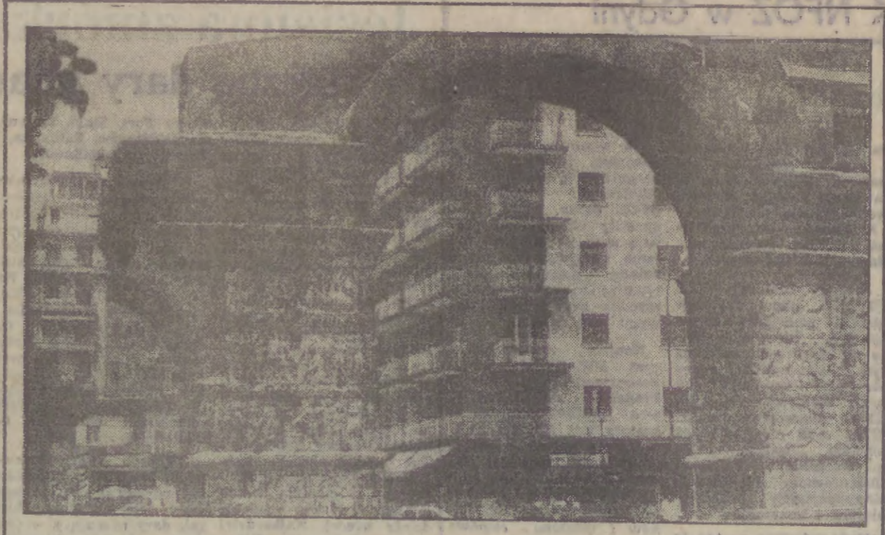
Jeden z najwspanialszych zabytków Salonik: łuk cesarza rzymskiego Galienusa.

ORZEKAŁO: „człowiek — to pieniądź” sformułował to przez wki, a w dobie odrabiania zajęć w różnych sferach życia wydaje się być szczególnie aktualne. Czy umiemy cenić czas? Spróbujmy zastanowić się nad tym, korzystając z analizy wykorzystania czasu pracy robotników w I półroczu br., sporządzonej przez Wydział Zatrudnienia i Spraw Socjalnych Urzędu Wojewódzkiego w Gdańsku. Jakiego rodzaju jest ta dzielnica? Stąd wypływa w I półroczu br. Otóż nominalny czas pracy — w porównaniu do pierwszych 6 miesięcy ub. roku — nie zmienił się. Natomiast niezauważnym pogorszeniu uległ wskaźnik wykorzystania nominalnego czasu pracy — na skutek wzrostu czasu nieprzepracowanego o 5,8 godzin (1 robotnik)