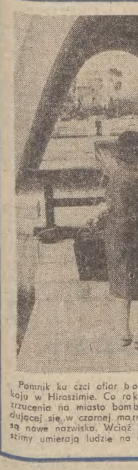
Pomnik ku czci ofiar bomby atomowej w Parku Pokoju w Hiroszimie. Co roku 5 sierpnia, w rocznicę zrzucenia na miasto bomby, do listy jej ofiar znajdującej się w czarnej marmurowej urnie, dopisywane są nowe nazwiska. Wciąż bowiem w szpitalach Hiroszimy umierają ludzie na chorobę popromienną.

W stolicy Japonii rozpoczęła się w niedzielę międzynarodowa konferencja przeciwników wojny nuklearnej. Biorą w niej udział przedstawiciele z 19 krajów i 9 organizacji międzynarodowych. Obrady od 4 sierpnia będą kontynuowane w Hiroszimie, a później w Nagasaki, w miastach, których mieszkańcy stali się pierwszymi ofiarami eksplozji nuklearnych.