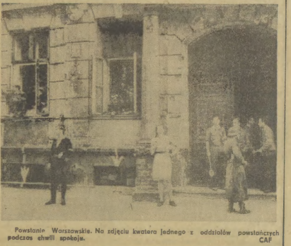
Powstanie Warszawskie. Na zdjęciu kwatera jednego z oddziałów powstańczych podczas chwili spokoju.