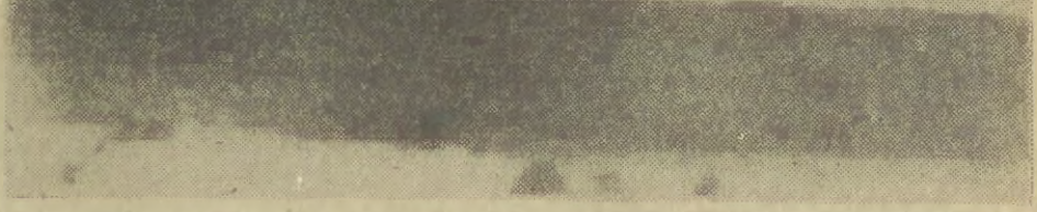
Lądowanie wahadłowca „Columbia”.

Byłoby zbyt wiadomo, że pod to nader pojemne pojęcie różne sily polityczne i różni ludzie podkładają różne treści. Towarzyszącym wypracowywaniu tego porozumienia wysiłkom może jednak przyswiecać optymizm, którego po atenuacji sprzyja wygaszenie w ostatnich dniach kolejnych ognisk społecznych konfliktów. Optyzm i nadzieja — rzecz można, wymuszone — wynika też z faktu, że, po prostu, nie ma innego rozsądnego wyjścia.