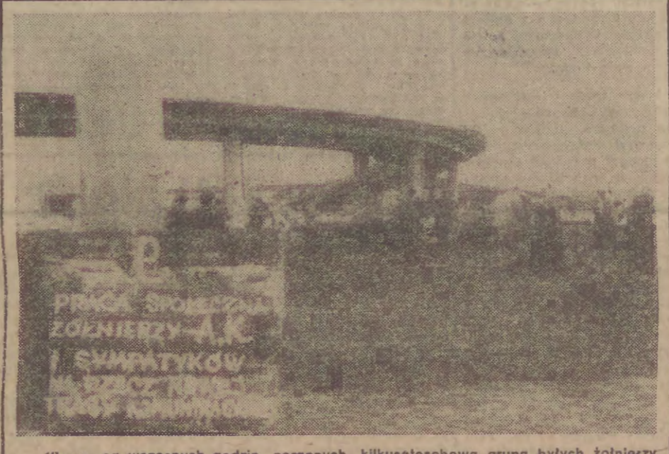
10 am. od wczesnych godzin porannych kilkusetosobowa grupa byłych żołnierzy AK, wraz z rodzinami pracowała w czynnie społecznym przy porządkowaniu terenu i zopieczu budowy Trasy Toruńskiej w Warszawie.

in. mediacje w sprawie Sahary Zachodniej zabiegał o broń w Stanach Zjednoczonych i Chinach. Człowiek, który nie był przyzwolenia prezydenta Sadata przewodniczył ty godniowym obradom gabinetu, co dawało mu znajomość podstawowych problemów społeczno — gospodarczych kraju. Hosni Mubarak uchodził za człowieka zdyscyplinowanego, punktualnego, wiele wy-