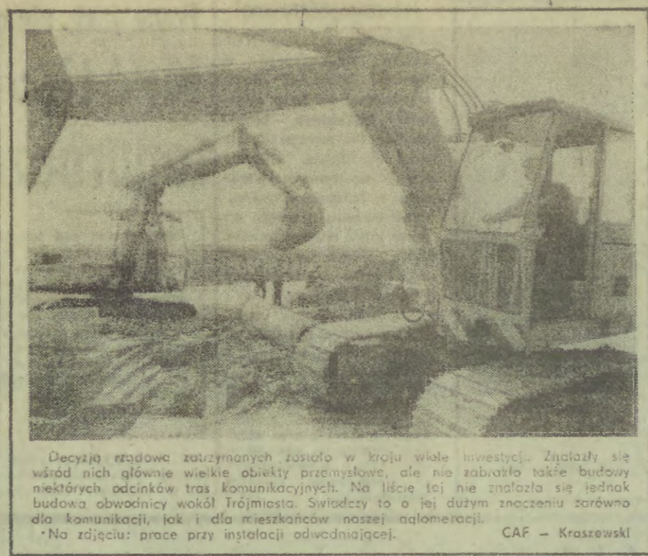
Decyzja rządowa zatrzymanych została w kroju wiele inwestycji. Znaczący się wśród nich głównie wielkie obiekty przemysłowe, ale nie zabrakło także budowy niektórych obiektów w celach komunikacyjnych. Na liście nie znalazło się jednak budowa obwodnicy wokół Trójmiasta. Swiżdowo to o jej dużym znaczeniu zarówno dla komunikacji, jak i dla mieszkańców naszej aglomeracji. * Na zdjęciu: prace przy instalacji odwadniającej.

„JAKO TO MA BYĆ REKOMPENZACJA?” Szeroki przekład opinii czytelników na ten temat zamieszcza w dwóch numerach „Słowa Polskie”. W każdym liście pada określenie „sprawiedliwa”, ale też dla każdego piszącego znaczy ono co innego. Większość uważa, że absolutna konieczność jest pełna rekompenzacja dla ludzi żyjących na granicy społecznego minimum. To minimum dla jednych to 2,5 tys. złotych, dla innych 3,5 tys., a są również opinie, że „minimum socjalne dla jednego członka rodziny w obecnej chwili po winno wynosić 4-5 tys. złotych”.