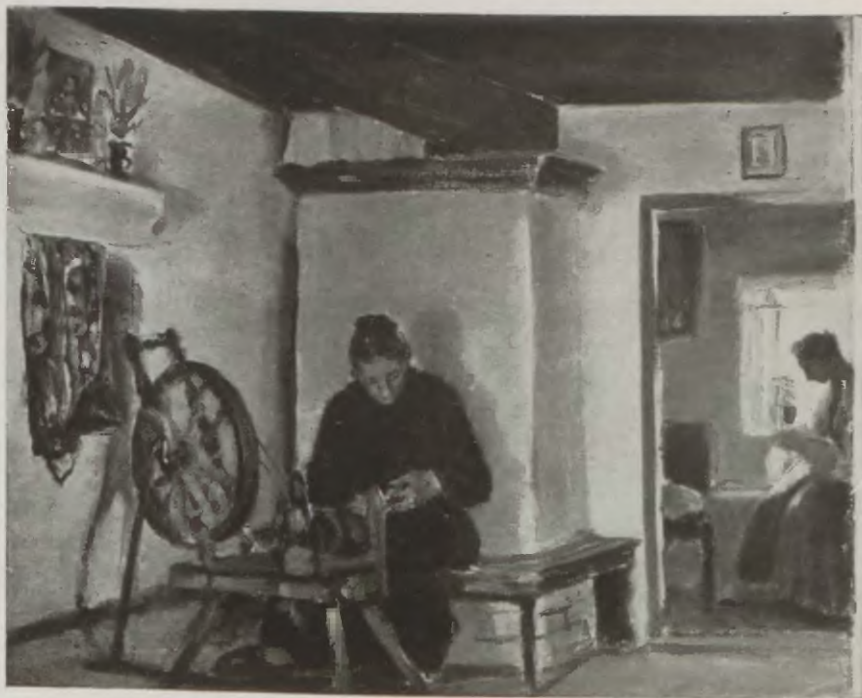
WNETRZE CHATY RYBACKIEJ. <CHALUPY>