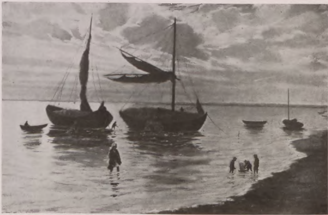
ZATOKA PUCKA. (JASTARNIA)