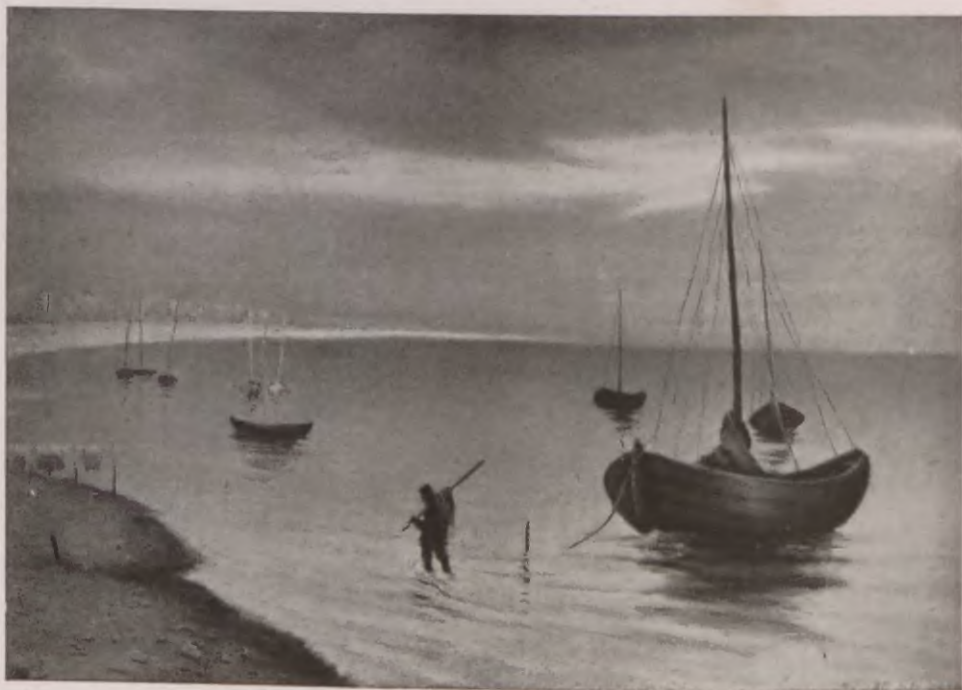
ZATOKA PUCKA, (BÓR)