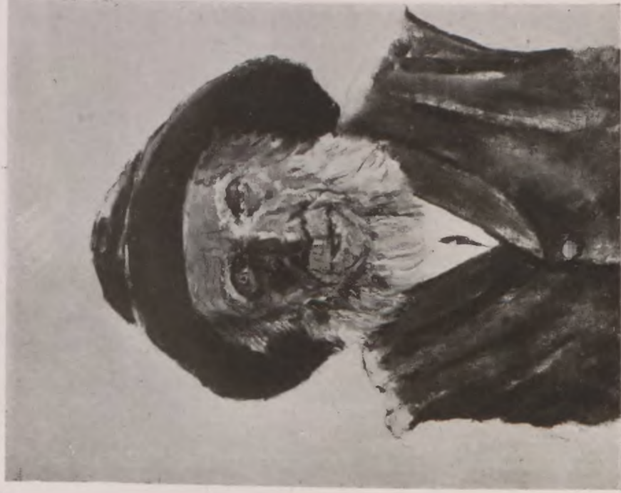
RYBAK Z HELU.