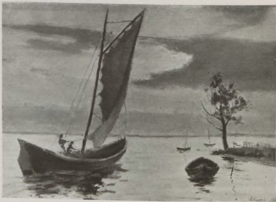
U BRZEGÓW JASTARNI.