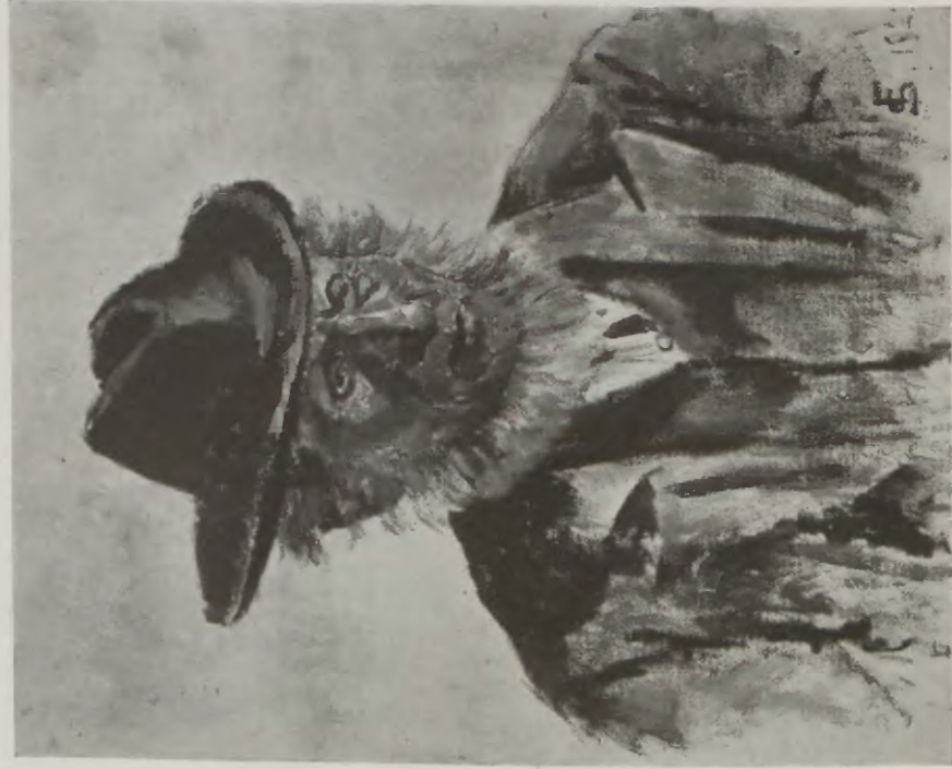
RYBAK Z JASTARNI.