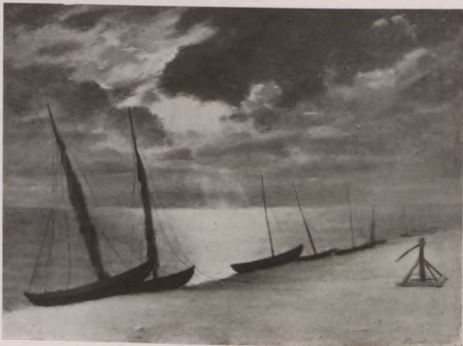
PRZED BURZĄ. <WIELKA WIEŚ>