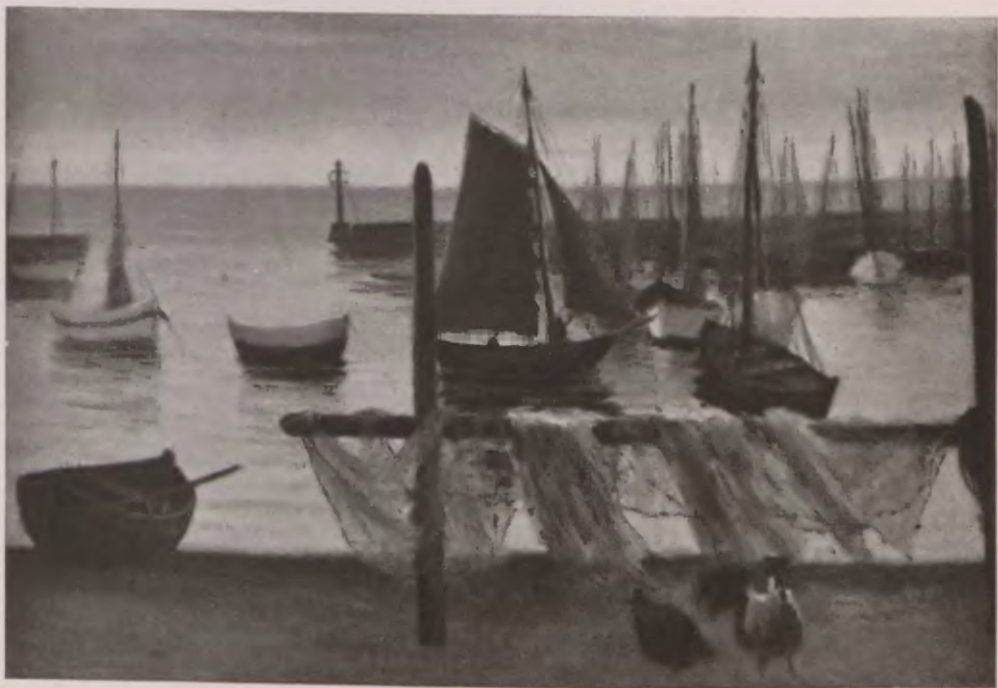
PORT W HELU.