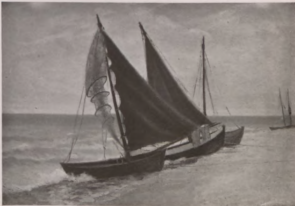
BRZEG W KUŹNICY.