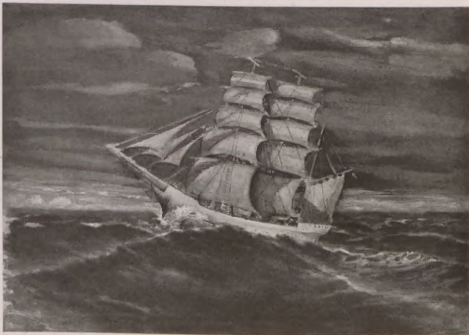
SZKOLNY STATEK „LWÓW” NA PEŁNEM MORZU.