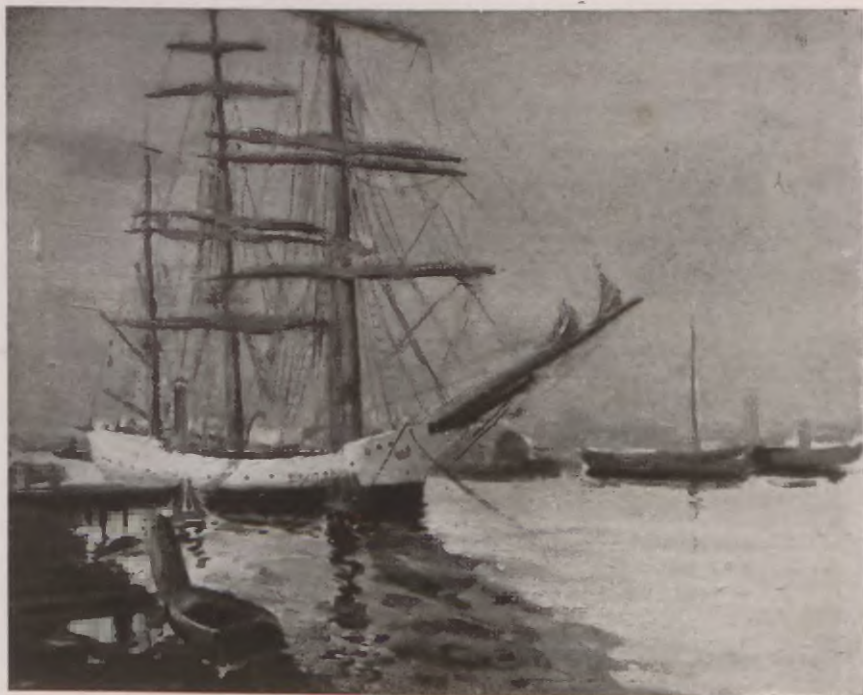
SZKOLNY STATEK „LWÓW” W PORCIE GDAŃSKIM.