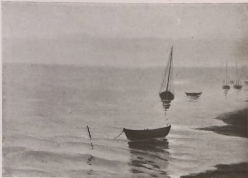
WIECZÓR NAD ZATOKĄ. (BÓR)