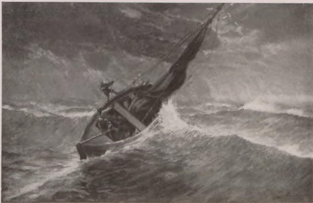
BURZA NA MORZU.