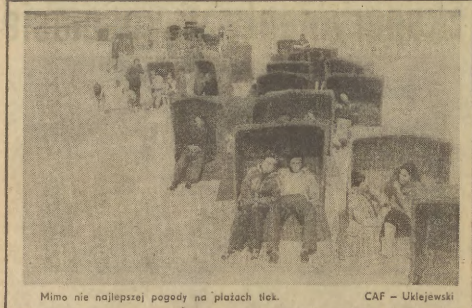
Mimo nie najlepszej pogody na plażach tleń.

Nadal utrzymywane są będzie deficyt niektórych artykułów branży chemicznej, w tym proszków do pralek i szorownic.