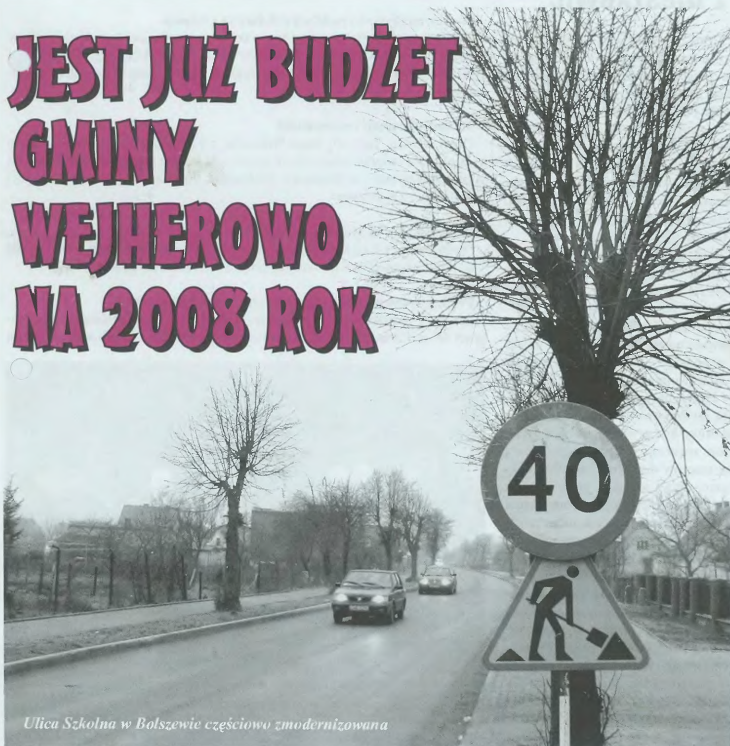
Ulica Szkolna w Bolszewie częściowo zmodernizowana