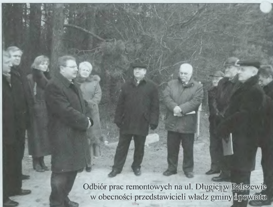
Odbiór prac remontowych na ul. Długiej w Bolszewie w obecności przedstawicieli władz gminy i powiatu

Zakończono zasadniczy etap modernizacji ul. Szkolnej w Bolszewie. Na długości od ul. Tartacznej do ul. Kochanowskiego założono kanalizację sanitarną