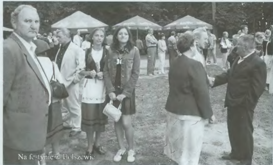
Na festynie w Bolszewie

Festyn pożegnania wakacji zakończył się zabawą taneczną do późnych godzin nocnych. sj