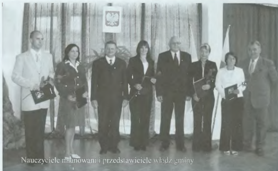
Nauczyciele mianowani i przedstawiciele władz gminy

Uczestnicy i wychowawcy kolonii w Łapszach Niżnych.