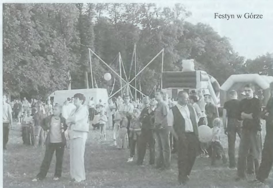
Festyn w Górze

Zabawa trwała do późnych godzin nocnych. sj