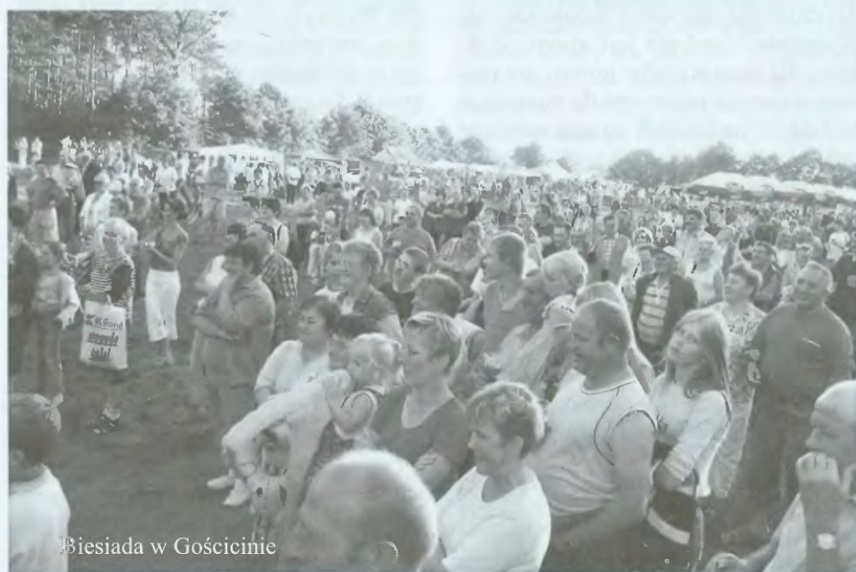
Biesiada w Gościcinie