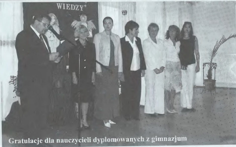
Gratulacje dla nauczycieli dyplomowanych z gimnazjum