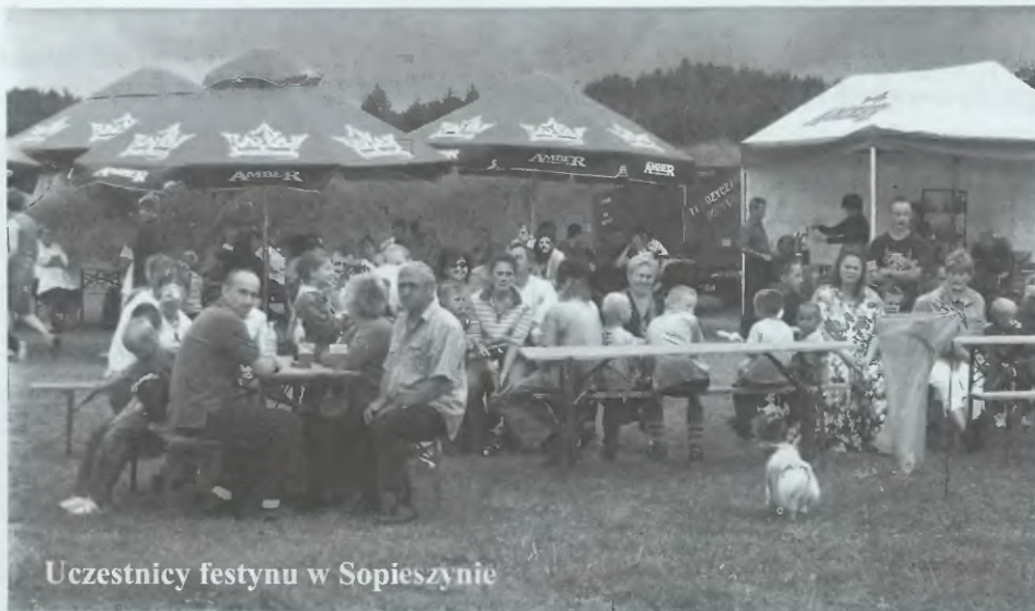
Uczestnicy festynu w Sopieszynie

Imprezie towarzyszyły liczne atrakcje: darmowa grochówka, stoiska z napojami i słodyczami, dziecięcy park rozrywki. Wiele emocji wzbudził turniej sołectw: Sopieszyno - Ustarbowo. Po zaciętym pojedynku zwyciężyło Sopieszyno.