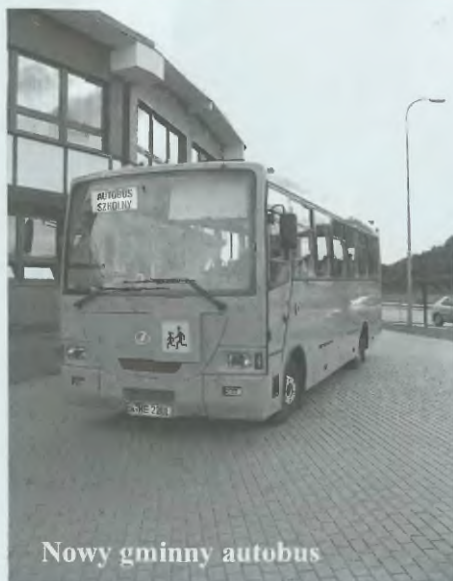
Nowy gminny autobus

Zmieniono w jednym punkcie Gminny Program Profilaktyki i Rozwiązywania Problemów Alkoholowych na 2004 rok. Do programu dodano zapis, który pozwala na dofinansowanie budowy placu zabaw przy świetlicy profilaktyczno-wychowawczej, działającej przy Samorządowej Szkole Podstawowej w Gościcinie, oraz placu zabaw przy remizie OSP w Gościcinie. sj