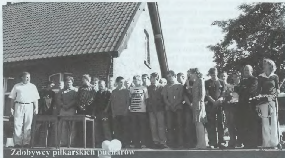
Zdobywcy piłkarskich pucharów