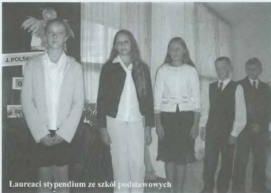
Laureaci stypendium ze szkół podstawowych