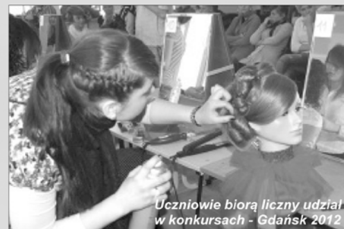
Uczniowie biorą liczny udział w konkursach - Gdańsk 2012