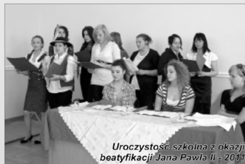
Uroczystość szkolna z okazji beatyfikacji Jana Pawła II - 2011