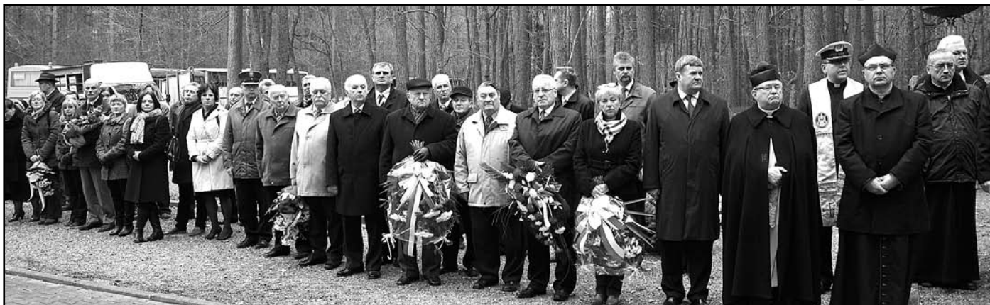
Modlitwa i zaduma jednoczą wszystkich zgromadzonych przed piaśnickim pomnikiem.

W Miesiącu Pamięci Narodowej Piaśnica kolejny raz wezwała do apelu. Tradycyjnie już pod pomnik nieopodal tej wyjątkowej nekropolii położonej w pobliżu Wejherowa przybyli m.in. posłowie na Sejm RP, przedstawiciele powiatu wejherowskiego oraz pucckiego, miasta Wejherowa, reprezentanci policji, wejherowskiego szpitala, Cechu Rzemiosł Różnych z Wejherowa, samorządowcy i dyrektorzy szkół z terenu gminy Wejherowo. Organizacją i oprawą uroczystości, zajęli się żołnierze z Centrum Wsparcia Teleinformatycznego i Dowodzenia Marynarki Wojennej.