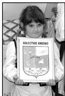
Rozśpiewane mieszkanki Kniewa z dumą prezentowały swój hymn i herb.