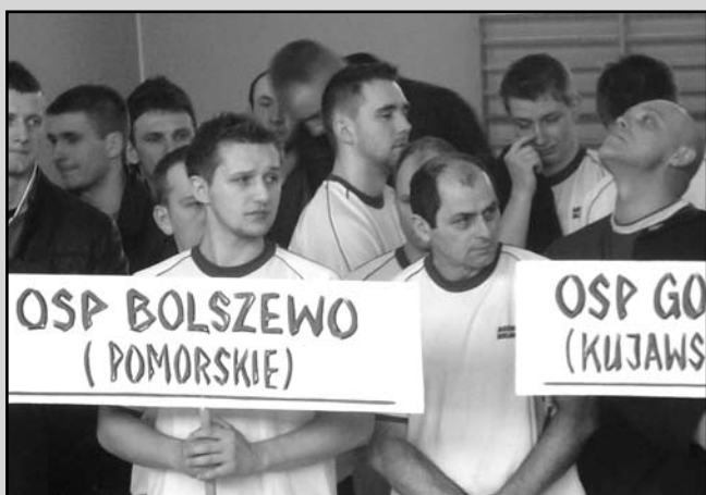
Strażacy z Bolszewa dumnie prezentowali się pośród drużyn z całej Polski

Strażacy z Ochotniczej Straży Pożarnej z Bolszewa wzięli udział w III Ogólnopolskim Turnieju Halowej Piłki Nożnej Drużyn OSP o Puchar Prezesa Zarządu Głównego Związku Ochotniczych Straży Pożarnych Waldemara Pawlaka. Po wygraniu eliminacji powiatowych, zawodnicy z Bolszewa reprezentowali w nich województwo pomorskie. Wśród 19 startujących drużyn w skali całej Polski walczyli oni zaszczytne, V miejsce. Wyjazd strażaków do Gąsawy koło Żnina ufundowany został przez Zarząd Powiatowy OSP w Wejherowie oraz Wójta Gminy Wejherowo. Strażakom – sportowcom serdecznie gratulujemy i życzymy dalszych sukcesów!