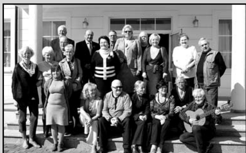
Uczestnicy pleneru przed dworkiem „Rajska Góra”