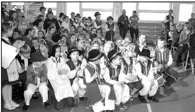
Sala gimnastyczna szkoły w Orlu na jeden dzień zamieniła się w miejsce spotkań wielu kultur