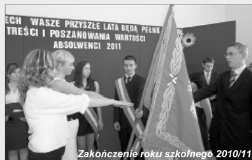
Zakończenie roku szkolnego 2010/11