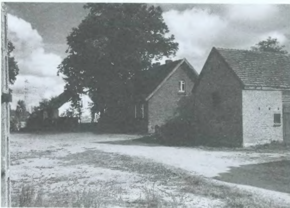
Budynek dawnej szkoły