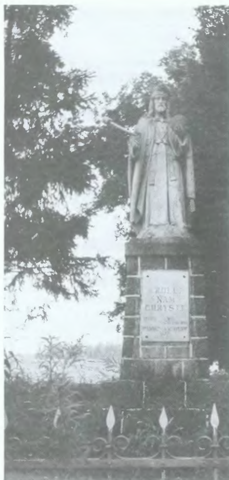
Pomnik Chrystusa Króla