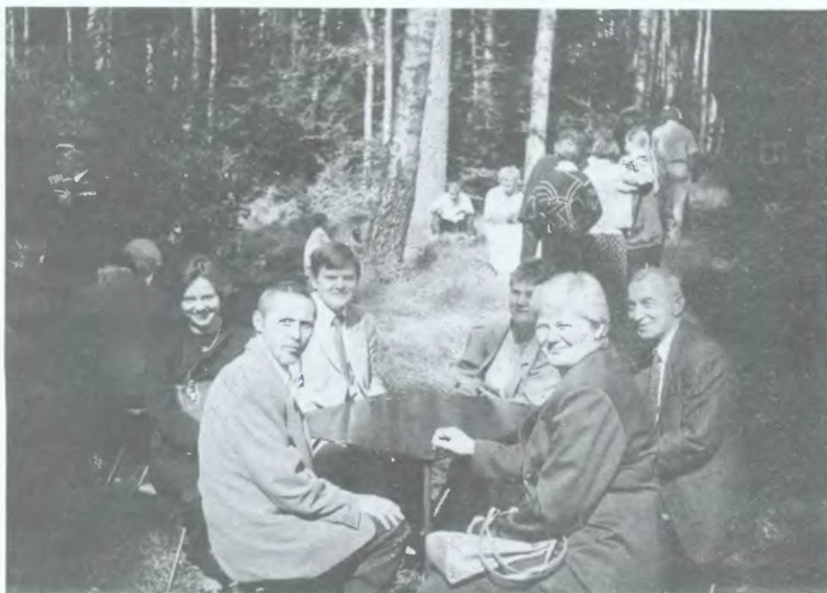
Dyrektorzy gminnych placówek oświatowych czekają na grochówkę

Spotkanie w Białej przygotował Urząd Gminy Wejherowo przy aktywnej pomocy organizacyjnej jednostki Ochotniczej Straży Pożarnej w Gowinie. sj