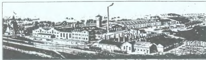
Największa fabryka krzesel stolarskich m Europie.