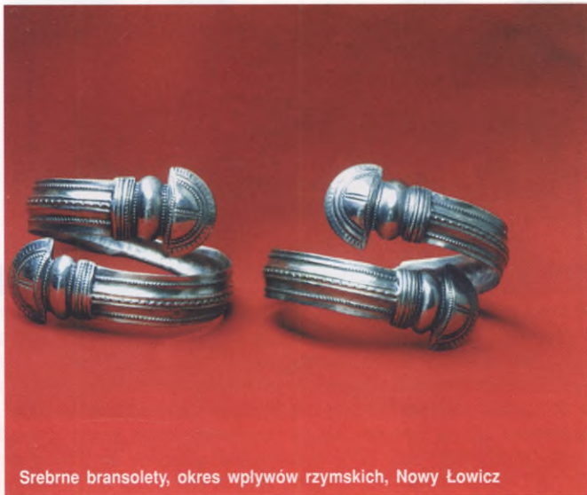
Srebrne bransolety, okres wpływów rzymskich, Nowy Łowicz

i kurhanowych (Gronowo, Nowy Łowicz) rodziny stosowały ciałopalenie lub chowały zmarłych nie spalonych. Do grobów nie składano już broni i narzędzi z żelaza. W jednej z gablot prezentowany jest szkielet kobiety z wyposażeniem z końca II wieku n.e. W tym czasie niezwykle wysoki poziom osiąga brązownictwo i złotnictwo, którego przejawem jest bogactwo ozdób kobiecych (zapinki, srebrne elementy kolii, bransolety, złote wisiorki oraz części pasa).