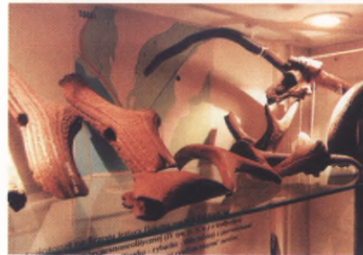
Narzędzia rogowe, wczesny neolit, Dąbki