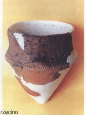
Naczynie ostrodenne, wczesny neolit, Koszalin-Dzierżęcino

W początkach epoki brązu (1800 - 1450 r. p.n.e.) Pomorze stanowi mozaikę kultur o rolniczo-pasterskim charakterze i neolitycznym rodowodzie, które różni stopień adaptacji nowych idei, nadal docierających z południa. Osiągnięcia neolitu wzbogaciło zastosowanie po raz pierwszy w dziejach metali do produkcji narzędzi i ozdób. Pierwsze wyroby miedziane szybko zostają zastąpione przez stopy miedzi i cyny (tzw. brązy), które są początkowo importami z południa. Na przełomie II i III okresu epoki brązu (1450-1200 r. p.n.e.) większą część Pomorza zamieszkuje ludność reprezentująca kulturę przedłużycką, należąca do kręgu kultur mogiłowych. Cechuje ją silnie już rozwinięta metalurgia brązu i szkieletowy obrządek pogrzebowy. W gablotach eksponowane są różnorodne przedmioty z brązu: miecze obosieczne, naramienniki, szpile, bransolety, a z narzędzi sierpy i siekierki.