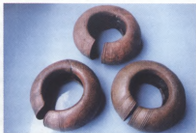
Nagolenniki ze skarbu, wczesna epoka żelaza, Malczkowo

Ludność kultury pomorskiej zamieszkiwała Pomorze jeszcze w starszym okresie przedrzymskim (= wczesnym i środkowym okresie lateralskim) epoki żelaza, aż do II wieku p.n.e.