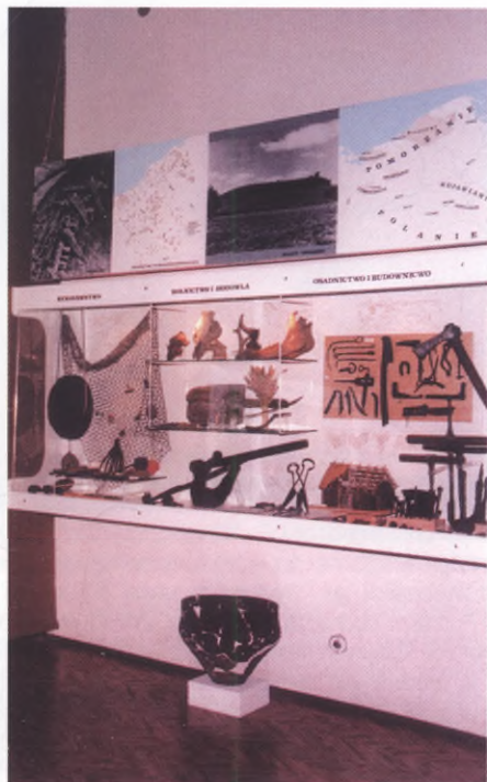
Fragment wystawy, wczesne średniowiecze

Na wystawie zaprezentowano modele i rysunki ilustrujące zarówno zajęcia domowe, jak i rozwijające się w średniowieczu rzemiosła oraz zabytki odkryte na terenie Pomorza Środkowego (Stare Drawsko, Radacz, Kołobrzeg, Białogard, Wiesiółka, Góra Chełmska).