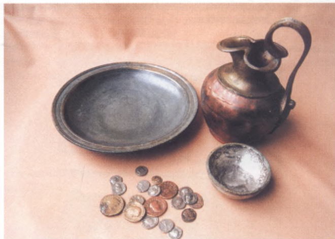
Naczynia i monety importowane z terenów cesarstwa rzymskiego

W okresie wędrówek ludów (375 - 570 r.) Pomorze, jak pozostałe ziemie polskie stało się areną burzliwych wydarzeń. Śladem osadnictwa z tego czasu są skarby monet i cennych ozdób, często w postaci złomu (Świelino, Trzebiatów) oraz pojedyncze groby z bronią (Główczyce). Sytuację etniczną u schyłku starożytności w Europie przedstawia mapa wędrówek ludów.