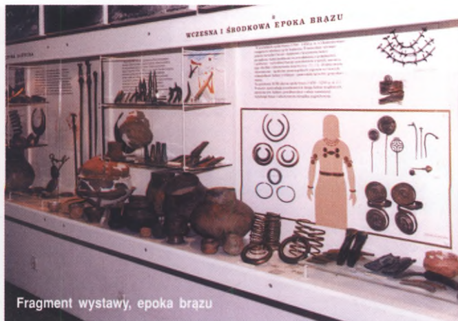
Fragment wystawy, epoka brązu

bóstwom darów wotywnych, przede wszystkim w wodzie. Odkrywane skarby przedmiotów brązowych i żelaznych (ozdoby, uzbrojenie, części rzędu końskiego) mogą być też śladem tezauryzacji dóbr materialnych i objawem postępującego zróżnicowania majątkowego ludności. Na liczne takie skarby natrafiono na Pomorzu; na wystawie prezentowane są znaleziska z miejscowości Jelenie, Kazimierz Pomorski, Koszalin-Rokosowo, Korlino, Kościernica, Żydowo.