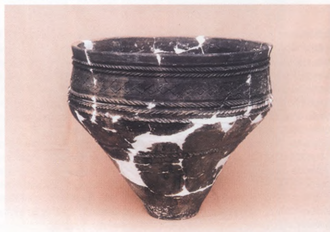
Naczynie wczesnośredniowieczne, Białogard-grodzisko

Okres wczesnośredniowieczny (VI - XII wiek) rozpoczyna nowy etap dziejów na Pomorzu - czasy historyczne, dla których dysponujemy zarówno zabytkami pochodzącymi z wykopalisk, jak i źródłami pisanyymi. Najstarsze ślady osadnictwa Słowian na Pomorzu pochodzą z VI wieku, a w VII wieku powstają pierwsze grody. W wiekach kolejnych następuje burzliwy rozwój osadnictwa, skupionego najpierw na urodzajnych glebach nad rzekami oraz postęp w różnych dziedzinach gospodarki. Pomorze stanowi wtedy mozaikę mniejszych plemion, wchodzących w skład Pomorzan, odłamu Słowian Zachodnich, włączonych w X wieku w obręb państwa polskiego.