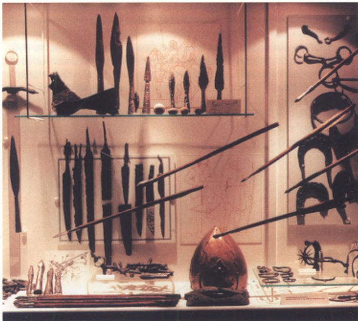
Elementy uzbrojenia, średniowiecze, Stare Drawsko