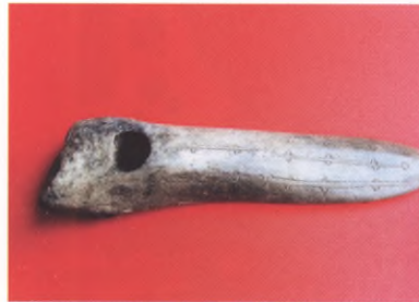
Motyka kościana, paleolit schyłkowy, Trudna

Harpun kościany, paleolit schyłkowy, Jezioro Mausz