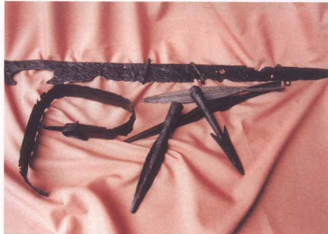
Broń żelazna, późny okres przedrzymski, Gostkowo

W młodszym okresie przedrzymskim (II - I wiek p.n.e.) na teren Pomorza docierają wpływy wysoko rozwiniętej kultury Celtów z Europy południowo-zachodniej oraz enklaw w Polsce południowej. Rozwój metalurgii żelaza z miejscowych rud darniowych, przyjęcie nowości technicznych (m.in. żelazne narzędzia do uprawy roli) oraz intensywne kontakty handlowe doprowadziły do wykształcenia się na Pomorzu kultury oksywskiej. Nadal panuje ciałopalny obrządek pogrzebowy, przy czym nowością jest składanie do grobów jamowych, bądź popielnicowych broni (mieczy, grotów, elementów tarcz). Podstawą gospodarki było rolnictwo i hodowla, uzupełniające znaczenie miało zbieractwo i łowiectwo. W gablotach obok naczyń i elementów uzbrojenia zaprezentowano liczne, powszechne w tym czasie ozdoby żelazne: zapinki i klamry do pasa oraz narzędzia: brzytwy i noże, pozyskane w trakcie badań w Warszawskowie i Niemicy koło Sławna, Gostkowie w woj. śluskim oraz z innych cmentarzyisk pomorskich.