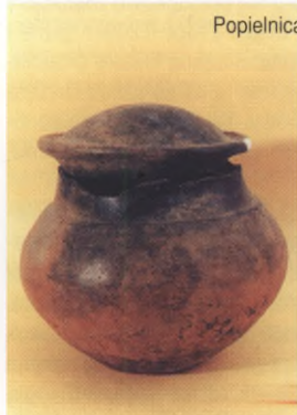
Popielnica z pokrywą, wczesna epoka żelaza, Klukowo

W okresie halsztackim wczesnej epoki żelaza (700 - 400 r. p.n.e.) na Pomorzu wschodnim kultura łużycka pod wpływem impulsów południowych ulega przekształceniom i jest nazywana kulturą pomorską. Cechuje ją oryginalność obrządku pogrzebowego przejawiająca się w kształtach popielnic - tzw. urn oczkowych, domkowych i twarżowych, składanych w komorach kamiennych - tzw. grobach skrzynkowych oraz ekspansywność, dzięki której stosunkowo szybko kultura ta rozprzestrzeniła się w kierunku południowym i południowo-wschodnim. Podstawą gospodarki było rolnictwo i hodowla, uzupełniane rybołówstwem, zbieractwem i łowiectwem. Mieszkało w budynkach słupowych naziemnych oraz ziemiankach i półziemiankach, przy czym osady, sytuowane głównie nad rzekami, miały charakter otwarty (nieobronny). Na wystawie, obok licznych i różnorodnych naczyń, przedstawione są m.in. fotografie grobów skrzynkowych z popielnicami (Gwieździn, Darškowo, Gostkowo) i grobów podkłoszowych (Osiek nad Notecią), przykłady wyrobów z metali (m.in. nagolenniki - Malczkowo, napiersniki wieloczęściowe, zapinki płytowe i skarb naszyjników - Tatów koło Koszalina) oraz ilustracja z rekonstrukcją słupowego budynku mieszkalnego.