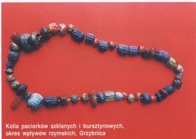
Kolia paciorków szklanych i bursztynowych, okres wpływów rzymskich, Grzybnica

Śladem kontaktów mieszkańców Pomorza z Cesarstwem Rzymskim i jego prowincjami są importowane naczynia z brązu i posrebrzane (Kretomino, Swolowo), monety oraz piękne kolie wielobarwnych paciorków szklanych i bursztynowych. Przejawem daleko posuniętego rozwarstwienia społecznego są tzw. groby książęce, zawierające liczne przedmioty importowane. Na 2 poł. III wieku datowany jest bogaty grób dziewczynki, odkryty w Białęcinie.